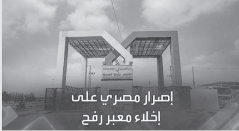
إصرار مصري على إخلاء معبر رفح