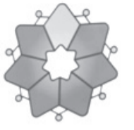
جانحة الحسين بن عبد الله للعمل التطوعي