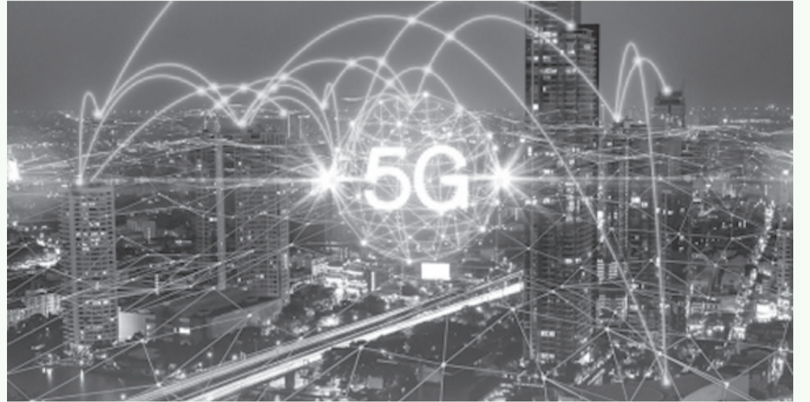
الأنباط - عمر الخطيب

وزمن انتقال أعلى مقارنة بـ 4G، مع سعة محدودة في المناطق المزدحمة مبينا أن 5G تتفوق في الإنترنت المحمول عريض النطاق، وتدفق الفيديو، والألعاب عبر الإنترنت، والصوت عبر (LTE) (VoLTE)، كما أنه يدعم تطبيقات إنترنت الأشياء الأساسية.