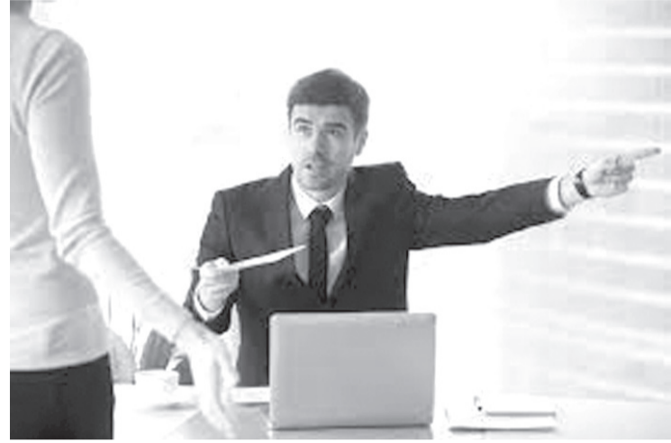
الأنباط - شذى حتاملة

أكدت وزارة التربية والتعليم في بيان صادر عنها أن موضوع معلمي التعليم الإضافي في بحثته لجنتا التربية والشباب واللجنة الإدارية في مجلس النواب في اجتماع مشترك حضره وزير التربية في ١٠ كانون الثاني من العام الماضي، اتفق خلاله على إصدار أسس جديدة تنظم عملية تكليف معلمي التعليم الإضافي.