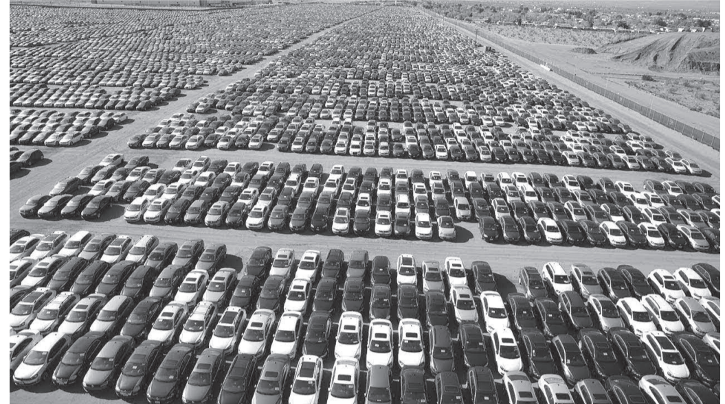
الأخبار – عمر الخطيب

نسبة جديدة من قبل الحكومة بنسبة ١٠ ٪ على سيارات الكهرياء في نهاية عام ٢٠١٩ ترتب على ذلك رجوع دخولها الى البلد.