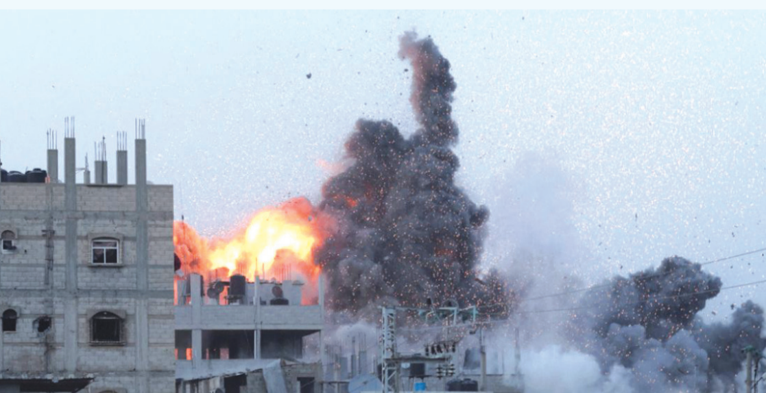
النباط - وكالات

هآرتس: أمريكا تضغط لإبرام صفقة في غزة لتجنب حرب إقليمية بالمنطقة