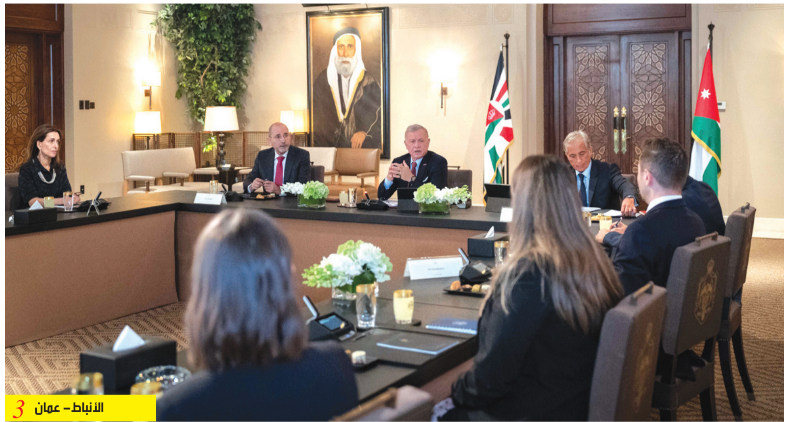
النباط - عمان 3

خلال ترؤسه لجلسة مجلس الوزراء الخصاونة: الأردن القوي هو الأقدر على إسناد الأشقاء في فلسطين