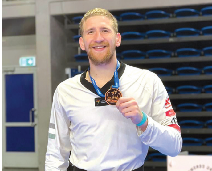
الأنباط - عمّان

الشابة إيماناً منها بقدراتهم الرياضية المميزة، ليحققوا المزيد من الإنجازات الباهرة عبر تمثيل الأردن في أبرز المحافل الإقليمية والعالمية، كما يأتي هذا التعاون لرفع مستوى الوعي بين أوساط الشباب حول الثقافة المالية الرقمية والمساهمة بتعزيز الشمول المالي بما يضمن تحقيق النمو الاقتصادي للأفراد والمملكة.