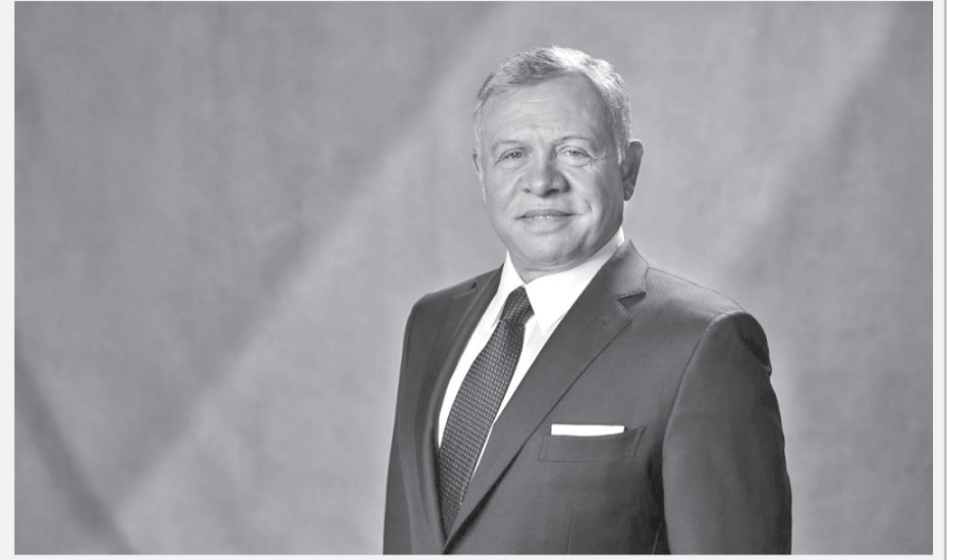
الأنباط- عمان تابع جلالة الملك عبدالله الثاني، أمس الثلاثاء، سير العمل في تنفيذ الاستراتيجية الوطنية للحماية الاجتماعية (٢٠١٩-٢٠٢٥)، الهادفة لتطوير قطاع الحماية والرعاية

الاجتماعية. وأكد جلالته خلال الاجتماع، الذي عقد في قصر الحسينية مع المسؤولين المعنيين، ضرورة تعزيز التمكين للفئات المشمولة في برامج الحماية الاجتماعية في جميع المحافظات. وناقش الاجتماع، بحضور رئيس الوزراء الدكتور بشر الخصاونة، سير العمل في خطط الحماية الاجتماعية للعامين الحالي والمقبل بما يتماشى مع رؤية التحديث الاقتصادي وبرنامجهما التنفيذي ضمن محور جودة الحياة. كما جرى استعراض ما تم إنجازه من برامج الاستراتيجية الحالية، إذ تم توسيع شمول الأسر المستفيدة من صندوق المعونة الوطنية وخدمات التأمينات الاجتماعية المقدمة لهم. بدورها، أوضحت وزيرة التنمية الاجتماعية وفاء بني مصطفى أن الخطوات القادمة لتحديث الاستراتيجية للأعوام (٢٠٢٦-٢٠٣٣) تركز على تطوير برامج تمكين الفئات الأكثر تأثراً بالظروف الاقتصادية، مشيرة إلى أن العمل جارٍ بالتنسيق بين الوزارات وجميع الشركاء بهذا الخصوص. وحضر الاجتماع مدير مكتب جلالة الملك، الدكتور جعفر حسان، ووزيرة التخطيط والتعاون الدولي زينة طوقان.