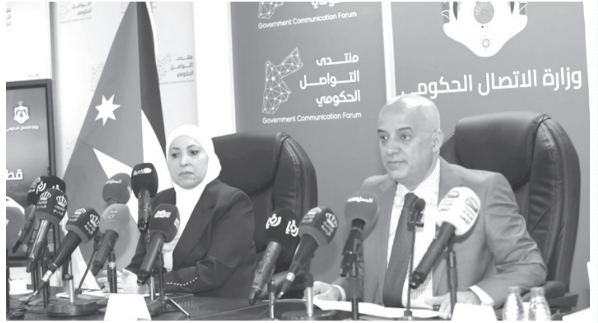
الأنباط - مينا بن يني ياسين

التهمتوني: نعمل على إعداد خطة مقترحة لخطوط التغذية لمشروع حاقلات التردد السريع