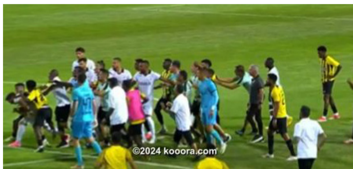
البرتغال - وكالات

في أولى مبارياته الودية بمعسكر البرتغال، استعدادا لخوض منافسات الموسم الجديد، بعد الانتهاء من التحضير في إسبانيا. شهدت مباراة اتحاد جدة وفارينزي