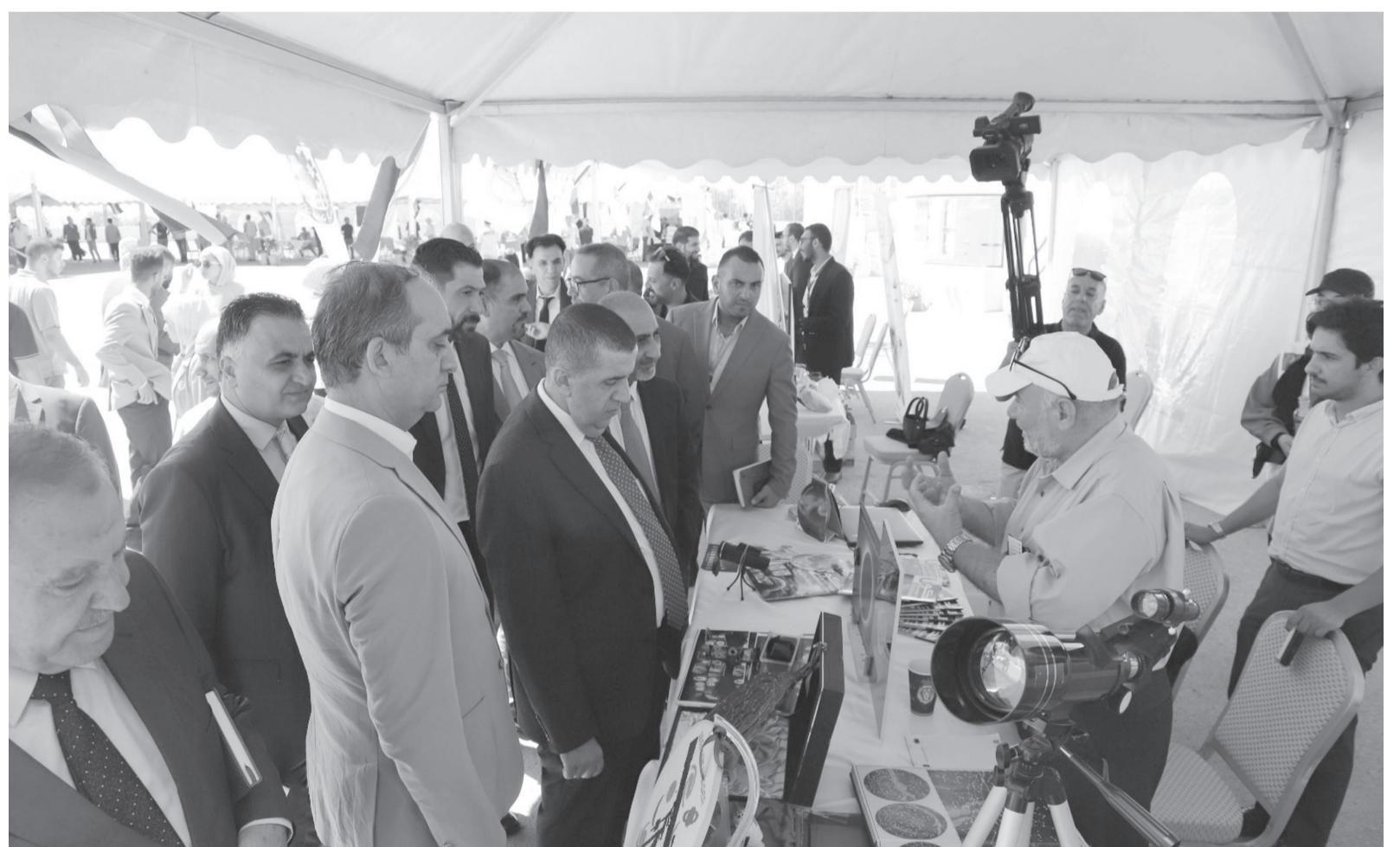
الأنباط - البلقاء

اللقاءات التي تعد خطوة في الإتجاه السليم مبينا أنه لا يمكن لأي برنامج أكاديمي أن يحقق أهدافه ما لم يكن هناك شراكات استراتيجية مع مختلف القطاعات، وتطلع من خلال هذا المنتدى إلى تضيق الفجوة بين مخرجات مؤسسات التعليم العالي وسوق العمل بالإضافة إلى مواكبة التغيرات المستمرة والانفتاح على الخبرات العملية المختلفة عبر التعاون مع عدد من المؤسسات الحكومية والخاصة. ولفت الدكتور العجلوني أن البلقاء التطبيقية رفعت شعار التعلم والتعليم من أجل التشغيل وعليه فقط بنت