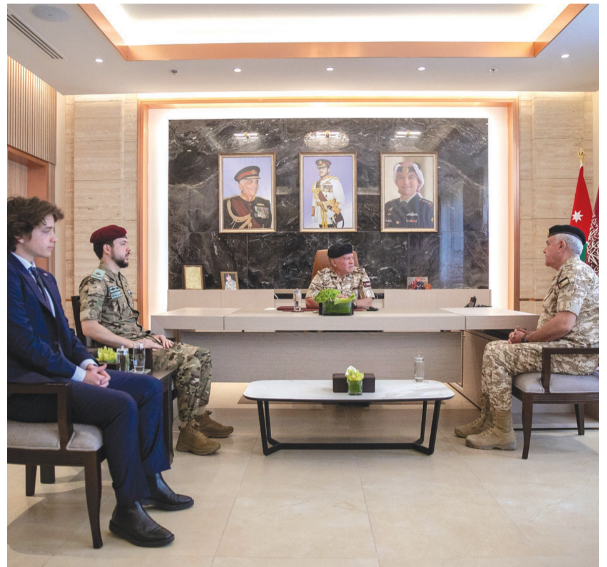
الانباط - عمان 3