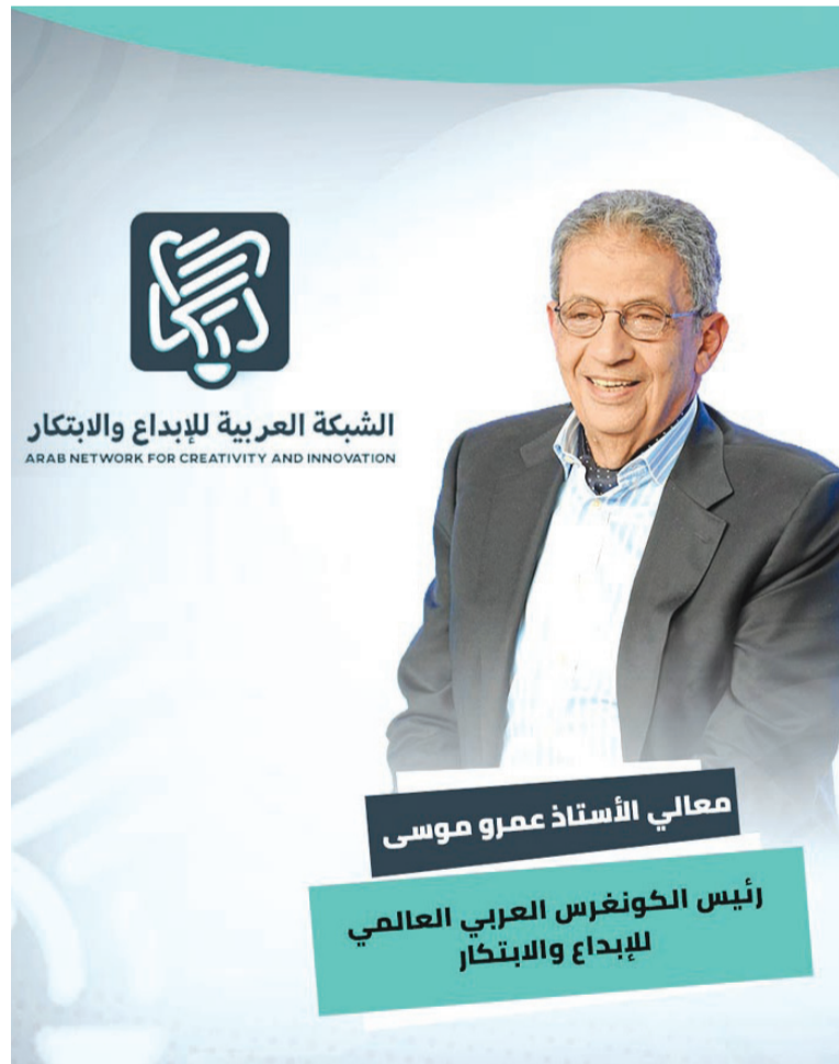
معالي الأستاذ عمرو موسى رئيس الكونغرس العربي العالمي للإبداع والابتكار