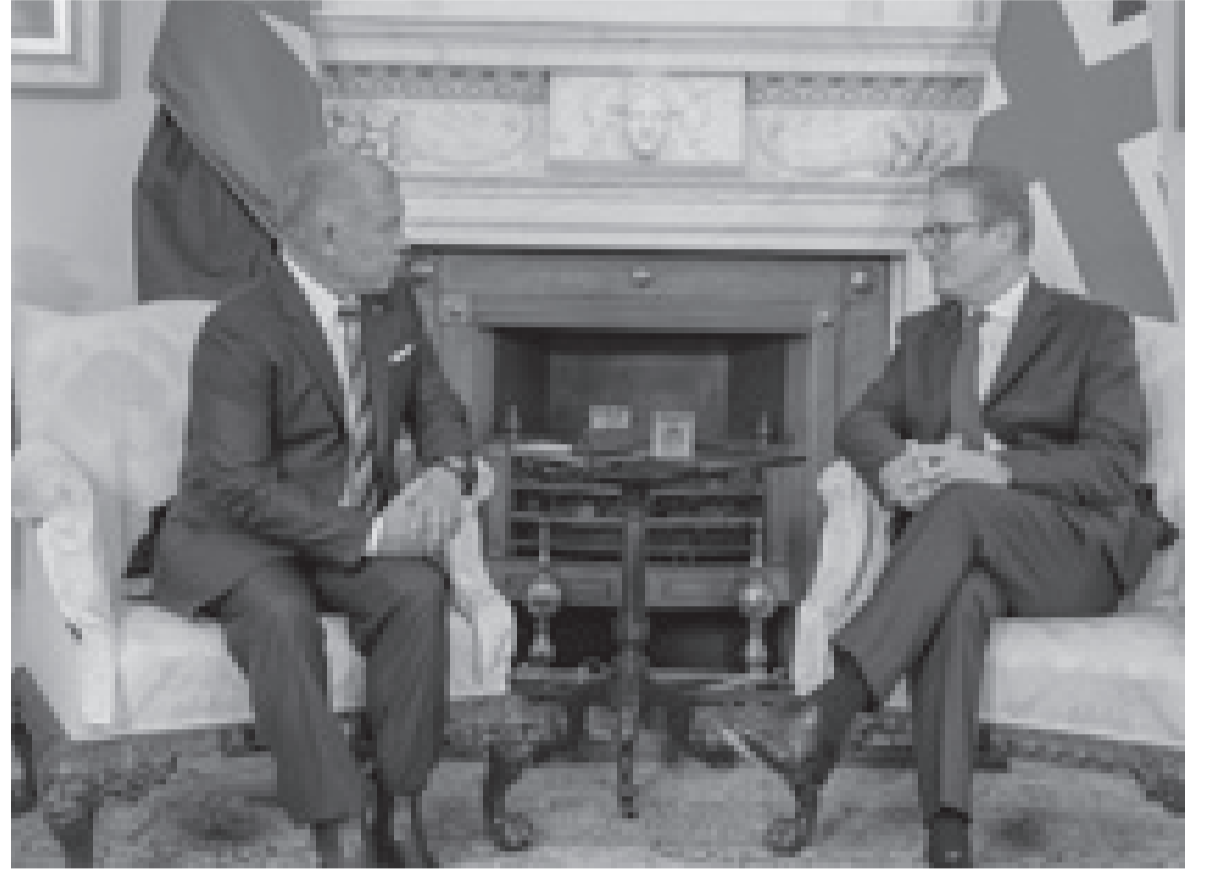
الأنباط - لندن

الملك يحذر من خطورة اتساع دائرة الصراع بالإقليم