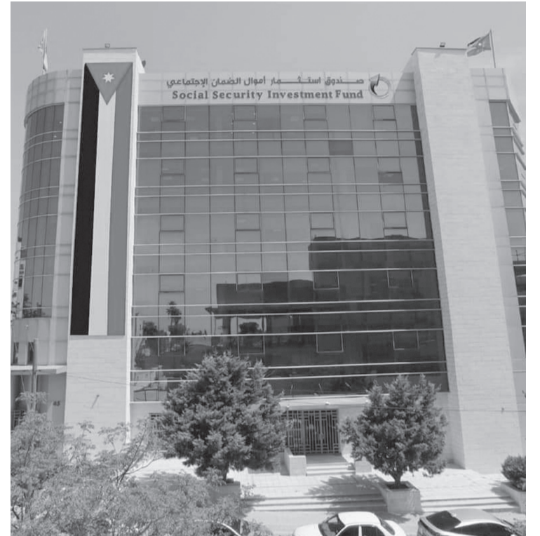
الأبناط - عمان

كما وصلت قيمة الاستثمارات العشرة القائمة في منطقة اربد التنموية الى ٤٥ مليون دينار وتوفر ٣٣٧٠ فرصة عمل، وتتوزع على قطاعات تكنولوجيا المعلومات والبرمجيات ومراكز اتصال وحاضنات ريادة الأعمال، إضافة