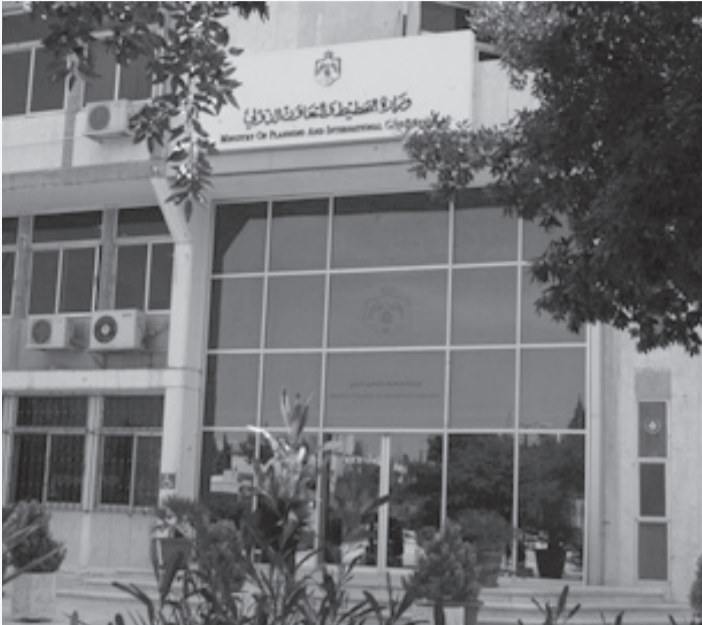
الأبناط - عمان

وحصلت جمعية تعاونية واحدة على ٥٢ ألف دينار لتنفيذ مشروع واحد. وبحسب البيانات، كانت قطاعات الشباب، والحماية الاجتماعية، والتنمية الاقتصادية، وتمكين المرأة، من أهم أولويات التمويل الأجنبي لدى مؤسسات المجتمع المدني خلال النصف الأول من العام الحالي، وحصل قطاع الشباب على الترتيب الأول بين القطاعات بقيمة ٦,٥٤ مليون دينار ونسبة ٢٤,٦ بالمئة، وقطاع الحماية الاجتماعية بقيمة ٥,٦٥٨ مليون دينار بنسبة ٢١,٢ بالمئة، وقطاع التنمية الاقتصادية بقيمة ٢,١٤٦ مليون دينار بنسبة ٨ بالمئة، وتمكين المرأة بقيمة ١,٩٠٢ مليون دينار بنسبة ٧,٢ بالمئة، بينما كانت قطاعات العدل والحوكمة أولوية أقل لدى مؤسسات المجتمع المدني أو مجتمع المانحين.