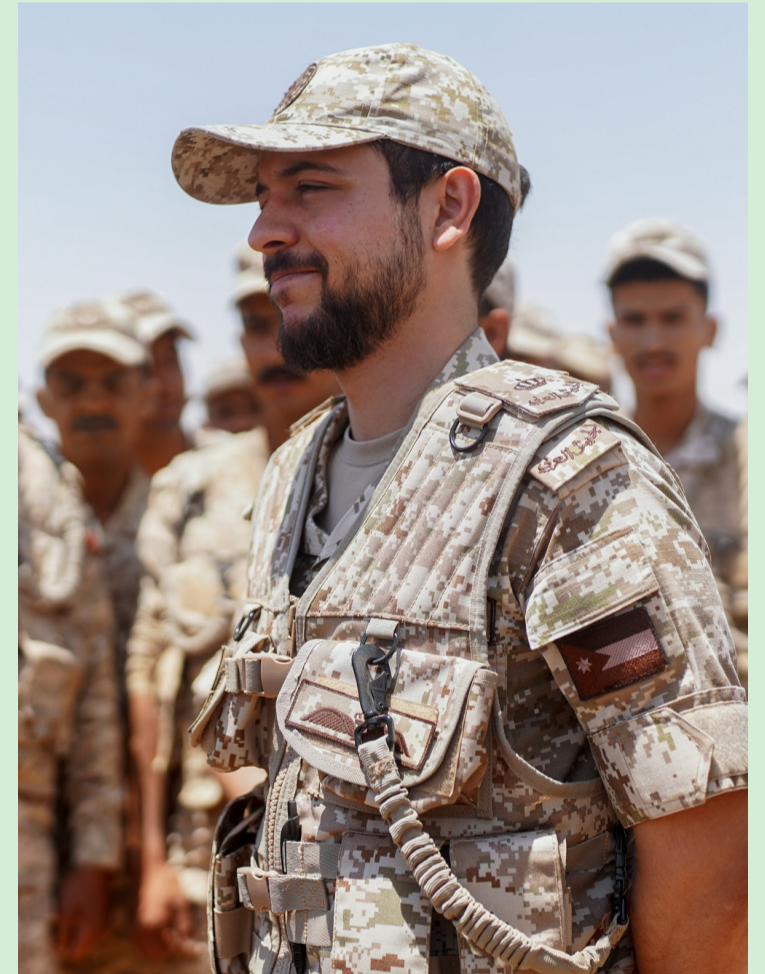
الأبناط - الكرك