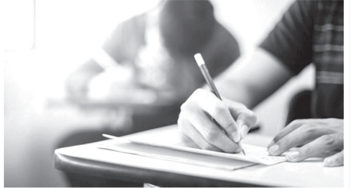
الانباط - سذى حتاملة

الامتحان ويحاول حل الاسئلة . فيما قال الناطق الإعلامي باسم الوزارة أن الطالب شريك بإخراج الورقة ل مصور الورقة . وأضاف في حديثه ل «الانباط» ، بأنه تلقى اتهاما ملفقا بأنه هومن قام بتهريب هاتف محمول إلى قاعة الامتحان والتصوير ورقة الامتحان، مما ادى إلى حرمانه من أداء امتحان التوجيهي لمدة سنتين، ما أدى الى