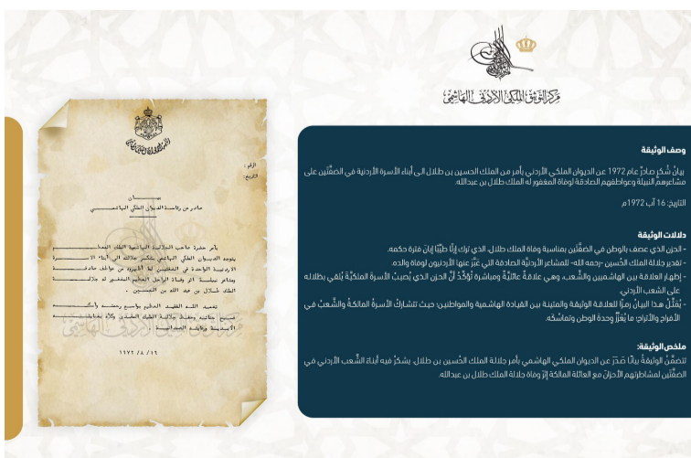
مركز التوثيق الملكي الأردني الهاشمي - 00962 6 4637341 - www.rhdcjo - info@rhdcjo

تقيم جمعية علماء الأمل الخيرية بالتعاون مع الجمعية السنورية الأمريكية SAMS، اليوم الاحد يوماً طبياً مجانياً في محافظة اربد. ويشمل اليوم الطبي الذي يقام