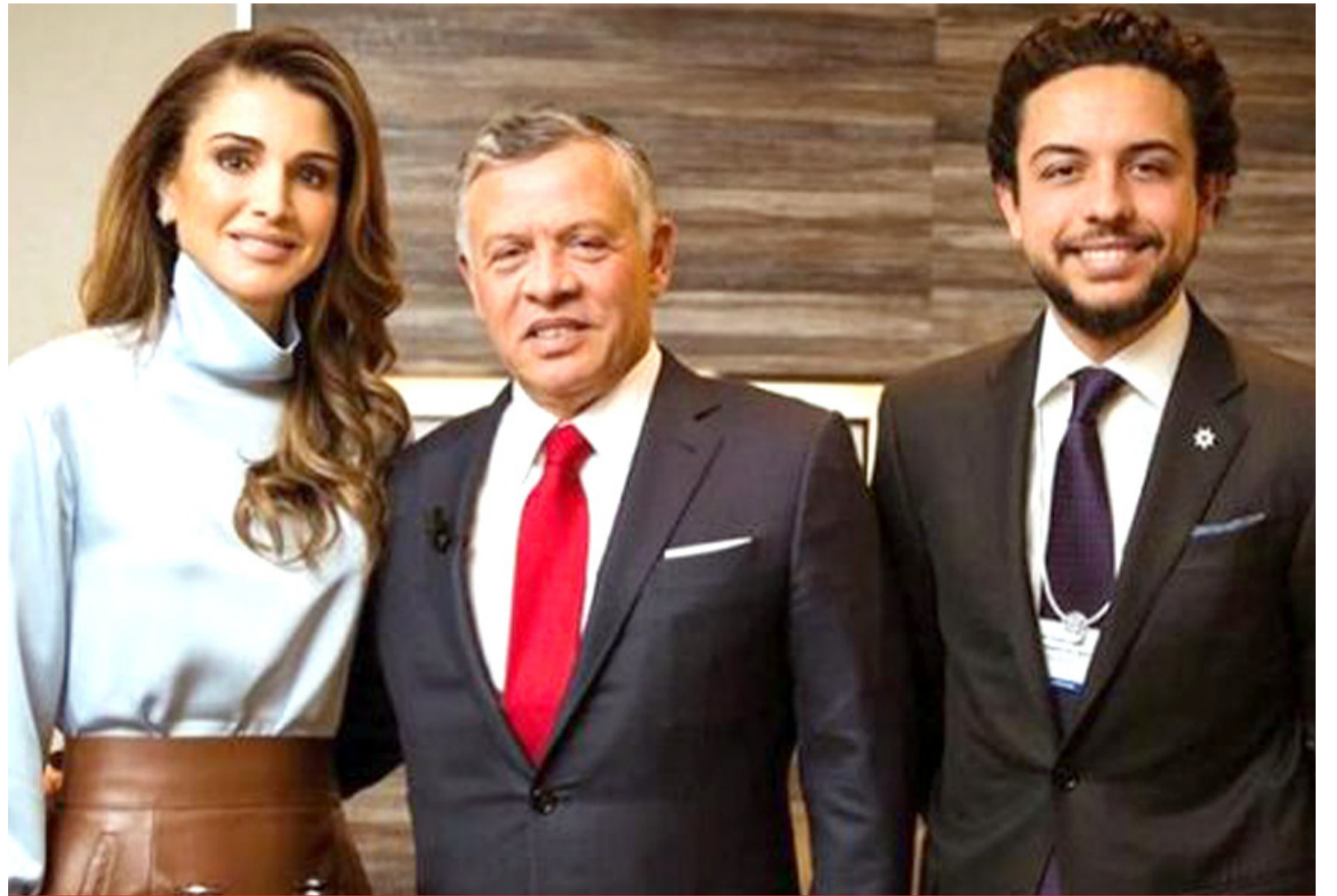
الأنباط - عمان، 2