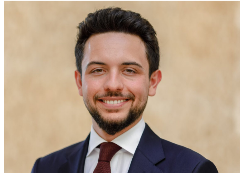
هنأ ولي العهد حسين بن عبد الله الثاني عبر حسابه على

هنأ جلالة الملك عبد الله الثاني في تغريدة نشرها على منصة (اكس) أمس السبت الشعب الأردني والأمتين العربية والإسلامية بمناسبة العام الهجري الجديد.