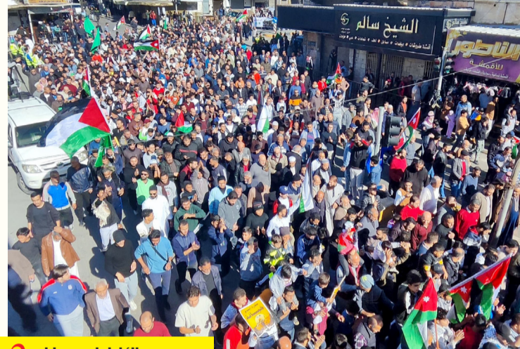
النابط - عمان 2