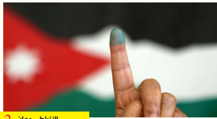
النابط - عمان 2