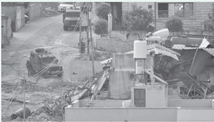
الأبناط-وكالات مدينة طولكرم شمال الضفة الغربية المحتلة.

وقالت إن هناك إصابات حالتها خطيرة نقلت إلى مستشفى طولكرم الحكومي، فيما أكدت جمعية الهلال الأحمر الفلسطيني في بيان بوقوع عدد من الإصابات إثر القصف.