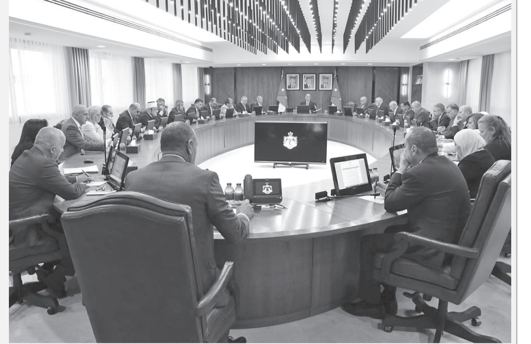
الأبناط- عمان أقر مجلس الوزراء في جلسته التي عقدها أمس نظاماً معدلاً لنظام ترخيص الجامعات الأردنية الخاصة وإنشائها لسنة ٢٠٢٤.