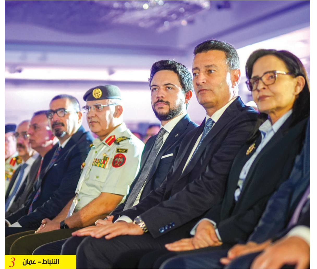
3 الأنباط - عمان

الخصاونة: الانقطاع نتيجة زيادة الاستهلاك ونقوم بالمتابعة