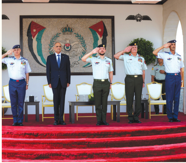
2 الأنباط - المفرق