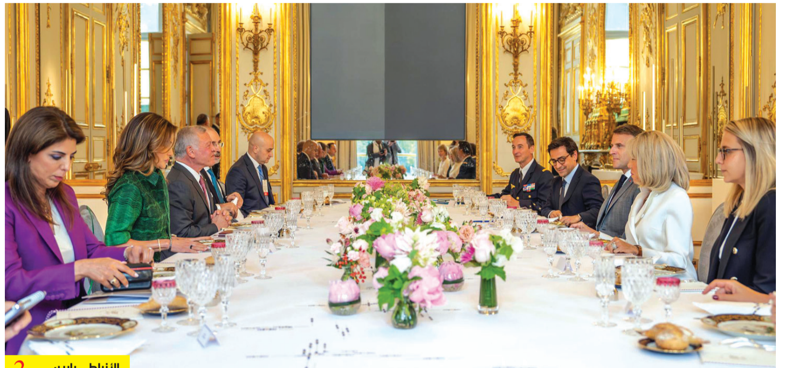
2 الأنباط - باريس

الملك أكد أهمية دور الأونروا فى تقديم الخدمات لنحو مليونى فلسطينى بالقطاع