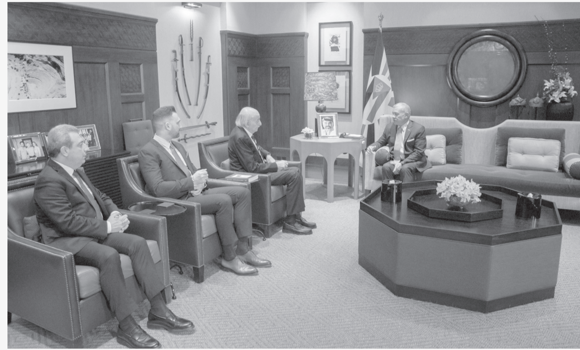
الأنياب - عمان

استقبل جلالته الملك عبد الله الثاني في قصر الحسينية، أمس الأحد، الرئيس السابق للحزب التقدمي الاشتراكي اللبناني وليد جنبلاط.