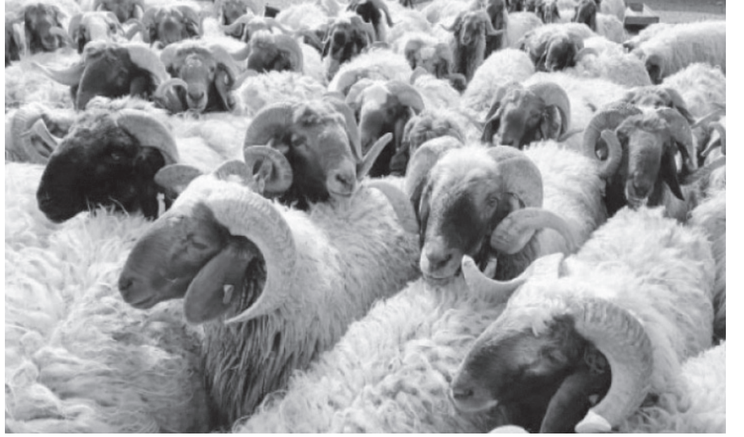
الأنباط - عمر الخطيب

جانز، ولكن الفقراء غير مطالبين بالأضحية ” ولا يكلف الله نفسا الا وسعها..