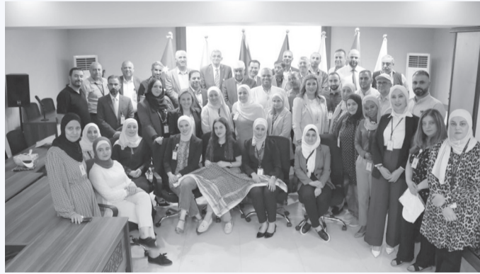
الأبّاط - عمان

والاعتزاز بالأردن، أرضاً وقيادة وشعباً، مشيراً إلى أن البنك يستمد من هذه المناسبات الوطنية العزيمية على مواكبة المسيرة لتحقيق مزيد من الإنجازات والتقدم والازدهار والمنعة.