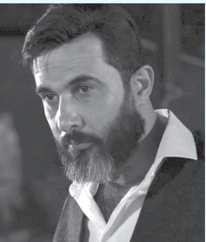
● خضر: السينما الأردنية حصلت على جوائز عديدة بالمهرجانات الدولية