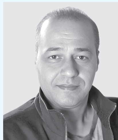
● الشطناوي: أتمنى ان يصل الفنان الاردني لمستوى أكثر تألقاً