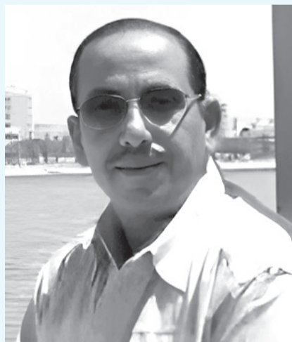
● دعباب: دعم جلالته انعش الدراما