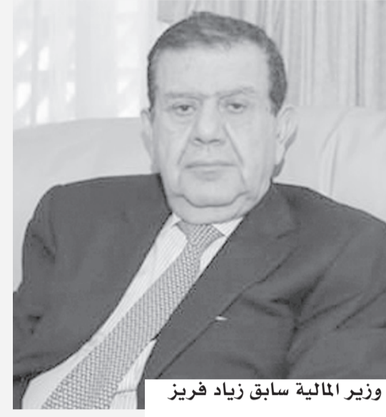
وزير المالية سابق زايد فريز

الاقتصادية وإعادة هيكلة الاقتصاد الوطني، وتفعيل دور القطاع الخاص وتوفير المناخ الاستثماري الجاذب وتطوير البنى التحتية ومعالجة المديونية على رأس الأولويات والأهداف الوطنية.