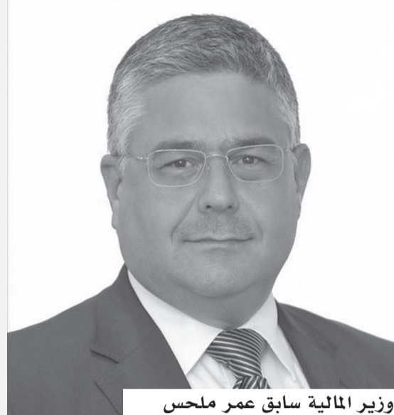
وزير المالية سابق عمر ملحس