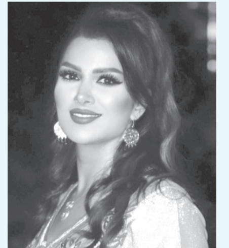
● عوض: مهرجان جرش من ابرز الانجازات..