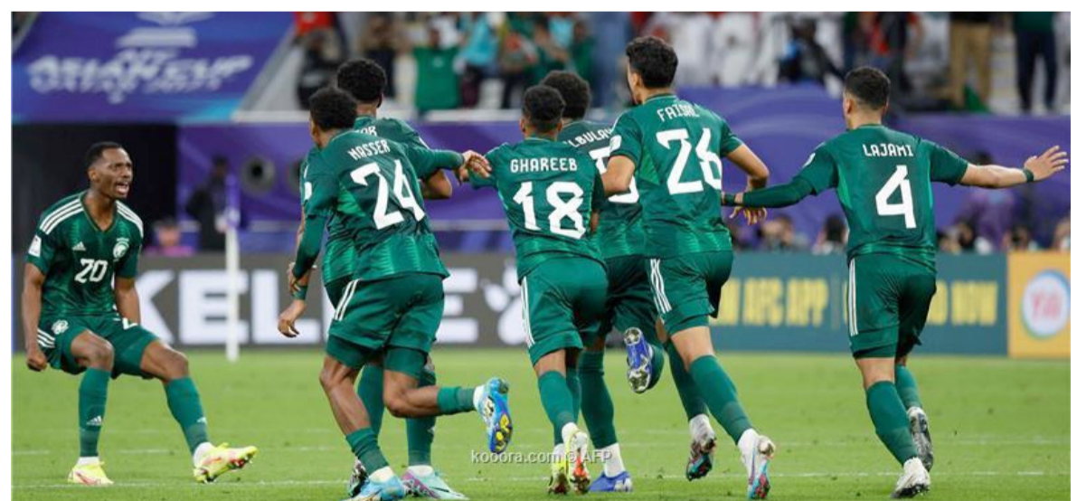
الرياض - وكالات

انتظم لاعبو المنتخب السعودي مساء الخميس في مقر معسكرهم في العاصمة «الرياض»، استعداداً لخوض الجولتين الخامسة والسادسة في ختام الدور الثاني من التصفيات الآسيوية لكأس العالم 2026 وكأس