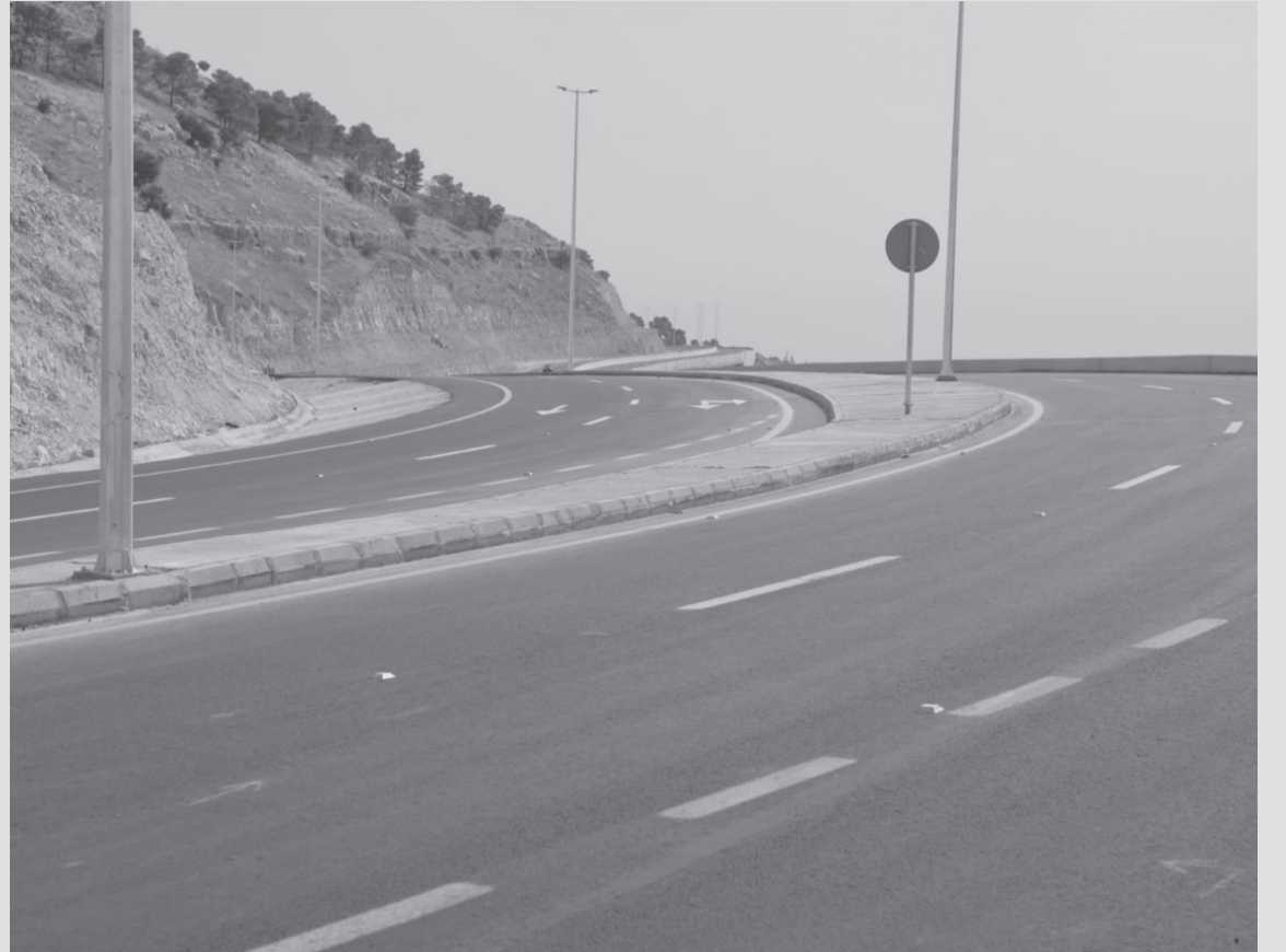
الأنباط - السّلت