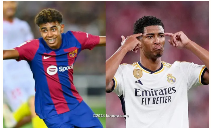
مديري - وكالات

لاعب أتلتيكو مدريد. وترشح لجائزة أفضل لاعب شاب بالدوري الإسباني خمسة لاعبين، أبرزهم ثنائي برشلونة لامين يامال، وياو كوبارسي. وتضم القائمة أيضاً كلا لاعب جيرونا، خافيير جيرا لاعب فالنسيا، وجوني كارديوسو لاعب ريال بيتيس. يذكر أن ريال مدريد توج بلقب الدوري الإسباني هذا الموسم للمرة ٣٦ في تاريخه ليوسع الفارق إلى تسعة ألقاب مع غريميه التقليدي برشلونة الذي فاز بالدوري ٢٧ مرة آخرها في الموسم الماضي.