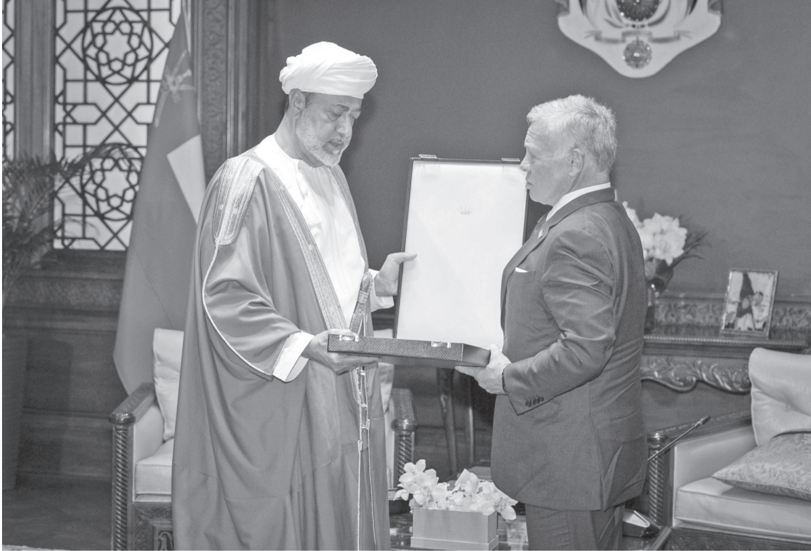
الأنباط - عمان

وتعد القلادة أرفع وسام مدني في المملكة الأردنية الهاشمية، وتمنح للملوك والأمراء ورؤساء الدول.