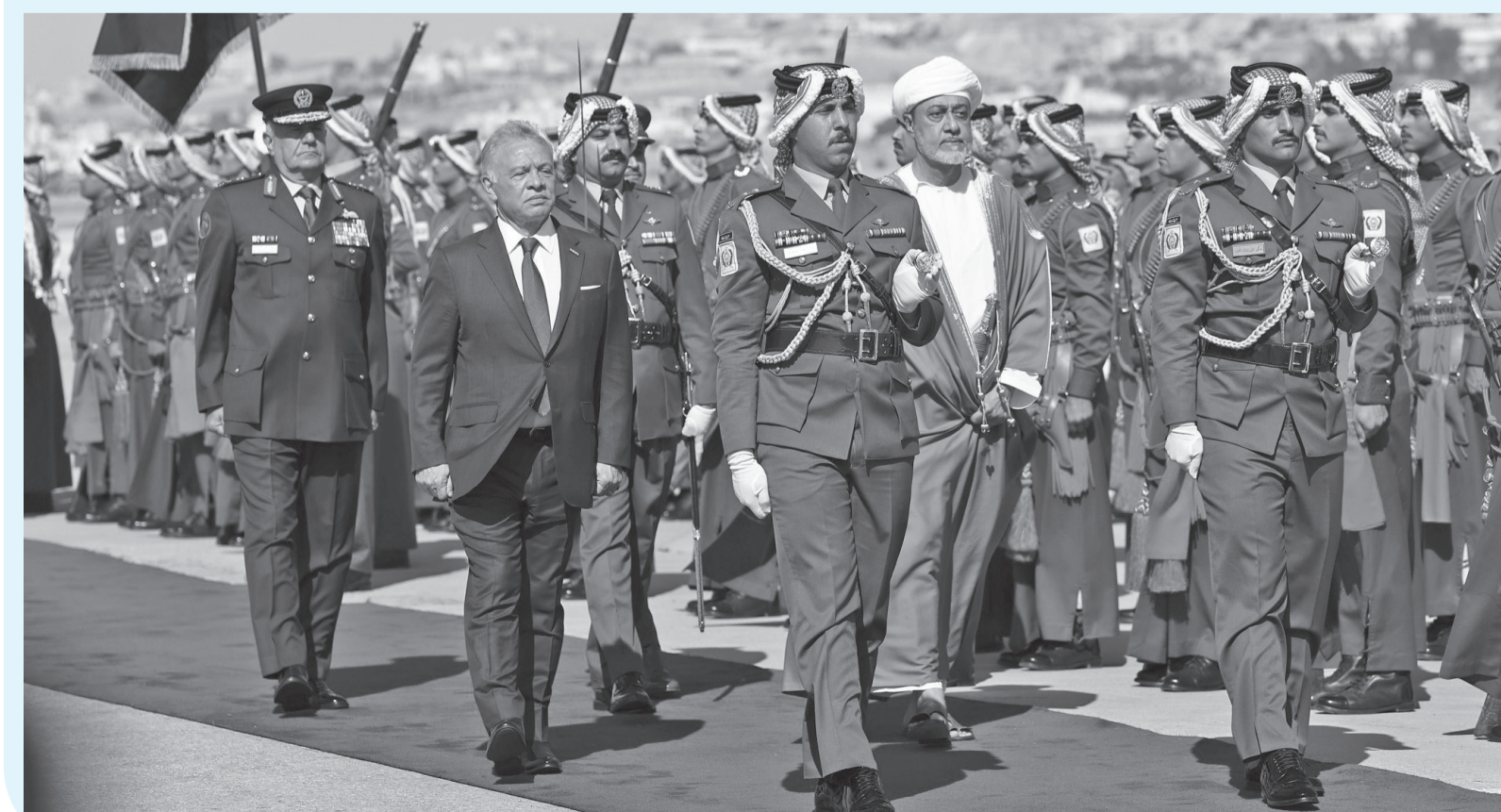
الأنياب - عمان

استقبل جلالته الملك عبدالله الثاني، أمس الأربعاء، جلالته السلطان هيثم بن طارق، سلطان عُمان، لدى وصوله مطار ماركا في زيارة دولة للمملكة.