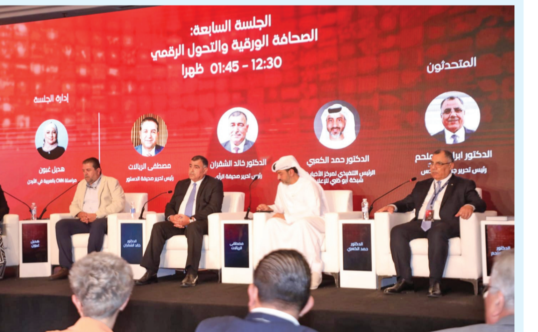
الأنباط - عمان

ولفت إلى وجود تشبيك مع مراسلين في غرف منذ اللحظة الأولى للحرب، قدمت خلالها "الدستور" خصوصية الحدث من وجهة نظرها كصحيفة، وأبرزت جهد المستشفى الميداني الأردني وجهد المراسلين الصحفيين كما أبرزت الأحداث للعالم، مؤكداً "يهمنا العمل لصالح الجمهور الأردني ولدينا مشروع لتطوير الموقع الإلكتروني بحيث يحتوي على سيرفترات وتبويبات للذكاء الاصطناعي جميعها موجودة لرفع مستويات التفاعل على المنصة الإخبارية.