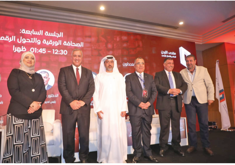
الأنباط - عمان

اليوبيل الفضي لتسلم جلالة الملك سلطاته الدستورية، وجلس جلالة على العرش، وبالتزامن مع العيد الثامن والسبعين لعيد الاستقلال.