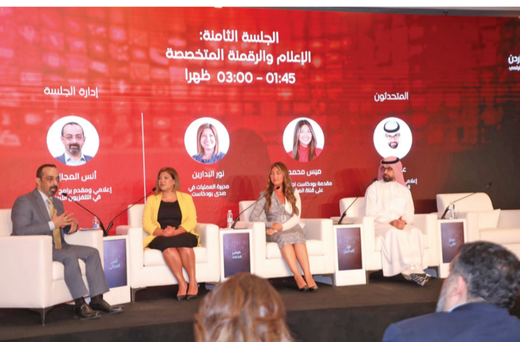
الأنباط - عمان

إضافة البصمة الخاصة للمقدم ويجب على مقدم البودكاست أن يكون صادقاً بالمحتوى الذي يقدمه للمتابعين.