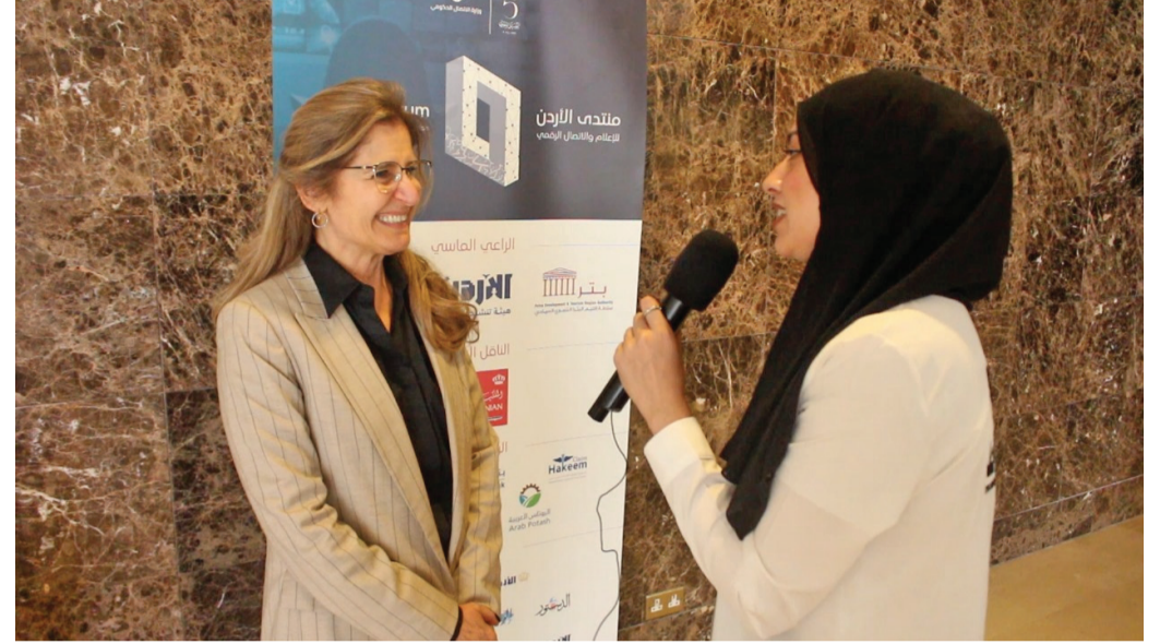
الأنباط - مينا س بني ياسين

القيام بعملهم وواجبهم كما هو مطلوب، لأن مهنة الإعلام تتطور بشكل سريع وبالتالي يجب أن يكون مقابل هذا التطور صحفي بمهارات عالية يشمل المعرفة في كل شيء. وأضافت في حديث لـ «الأنباط» أنه يجب على الصحفي في تطور وسائل التواصل الاجتماعي وأدوات الإعلام أن يكون ملماً في أساليب التصوير وطرح الأسئلة والتحضير والإعداد والإخراج، لا سيما أن الذكاء الاصطناعي يوفر للصحفي مهارات التحقق ومعرفة المعلومات والصور والتحقق من صحتها، لأنه هو من يبني المصدقية مع