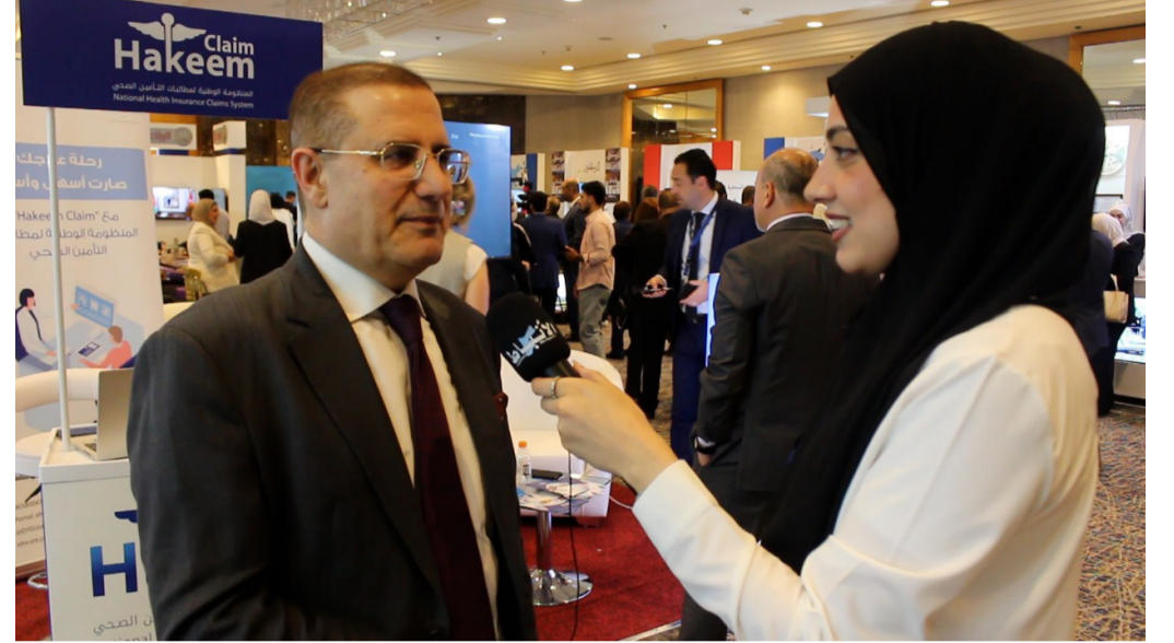
الأنباط - مينا س بني ياسين

سواء كان محللاً أو لاعباً أو حتى مشجعاً أن يتعامل بشكل منطقي دون تعصب، مبيناً أنه من الضروري أن يعمل الصحفي والإعلامي الرياضي على جعل التلقي يسمع منه تحليل لياحة برشلونة وريال مدريد دون تحيز أو شعوره بان الإعلام بيدي تشجيعه بشكل متعصب، موضحاً أن الإعلام الرياضي دوره الأساسي يكمن في جعل المشجع دون روح رياضية عالية بعيداً عن ظاهرة عدم احترام الخصم والفرق المنافس. ويبين أن ظاهرة التعصب ما زالت في تزايد مستمر، وأنها