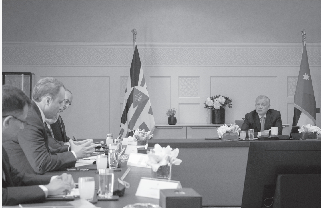
مليار دينار سنويا، بينما يوظف القطاع ٨٩ ألف عامل، ٣١ بالثة منهم أردنيون. وحضر الاجتماع مدير مكتب جلالة الملك، الدكتور جعفر حسان.

أكد جلالة الملك عبدالله الثاني أهمية القطاع الصناعي للتسيخ (المهيكات) في التشغيل وتعزيز النمو الاقتصادي وزيادة الصادرات، خلال اجتماعه بممثلين عن القطاع، أمس الثلاثاء. وتناول الاجتماع، الذي عقد في قصر الحسينية متابعة التقدم في تطوير قطاع المهيكات انسجاما مع رؤية التحديث الاقتصادي، بحضور رئيس الوزراء الدكتور بشر الخصاونة، آليات تعزيز التعليم المهني لرفع قطاع المهيكات بالعمالة المؤهلة، واعتماد مناهج تدريب للعاملين في القطاع الصناعي وبناء قدراتهم. وتبلغ مساهمة القطاع الصناعي للتسيخ (المهيكات) في الناتج المحلي الإجمالي ٧٥٦ مليون دينار. وتشكل منتجات المهيكات ٢٠ بالمئة من الصادرات الصناعية، إذ تبلغ قيمة صادرات القطاع ١٤