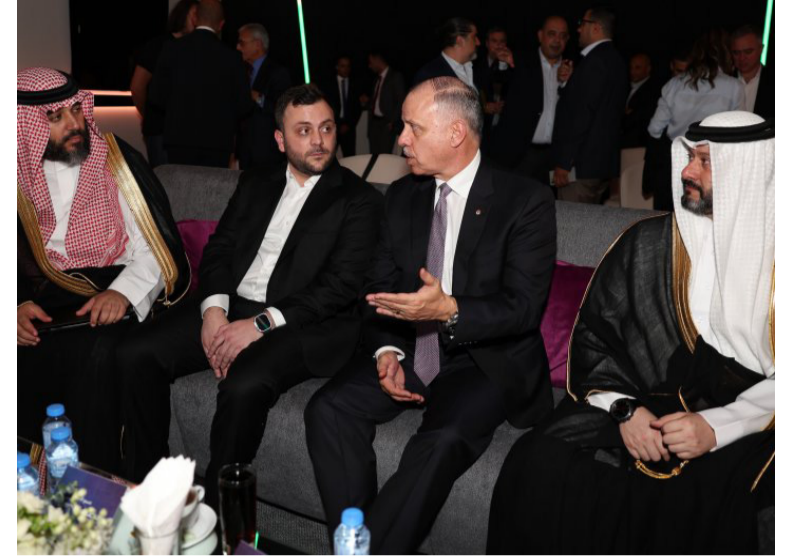
الانبا - عمان

الخميس حفل افتتاح المقر الرئيسي للاتحاد الأردني للرياضات الإلكترونية. وحضر حفل افتتاح المقر في مجمع الملك الحسين للأعمال بالعاصمة عمان سمو الأمير عمر