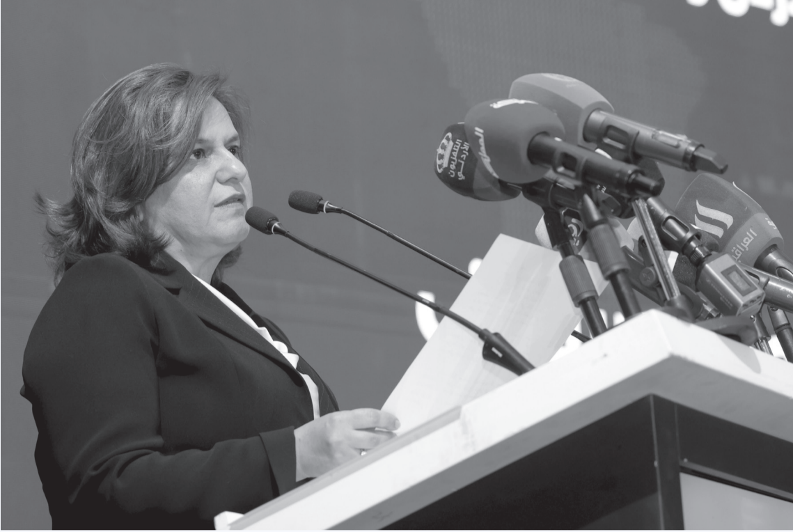
الأبواب - البحر الميت

وأول مرة بإنشاء صناديق الاستثمار لرصد الأموال لغايات استثمارها في الأنشطة الاقتصادية، الأمر الذي يسهم في تحفيز رؤوس أموال المؤسسات الاستثمارية واجتذابها.