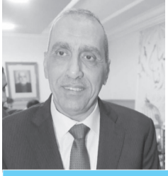
فاضل محمد الحمود

تبقى هذه القصص الجميلة التي تنبثق من قلوب أصحاب هذا البيت العظيم الذي حمل بين أركانه صفوة الخلق في آل بيت رسول الله عليه أفضل الصلاة والسلام فداًب آل هاشم عبر تاريخهم المنسوج من خيوط المحبة والسلام برسم أفضل لوحات التواضع التي جعلتهم الأقرب إلى قلوب الناس فكان وما زال وسيبقى هذا البيت الكريم يتحلى بسمات الخلق العربي الأصيل النابض بالنخوة والشهامة ويبقى الناظر هنا إلى مواقف جلالة الملك عبدالله الثاني ابن الحسين الذي رسم الفرحة على وجوه الأطفال وربت بكفه المعطاء على أكتاف المستنين وانحنى لهم ليستمع إلى صوتهم الضعيف وليلبي ما يحتاجونه بكل حب وعطف.