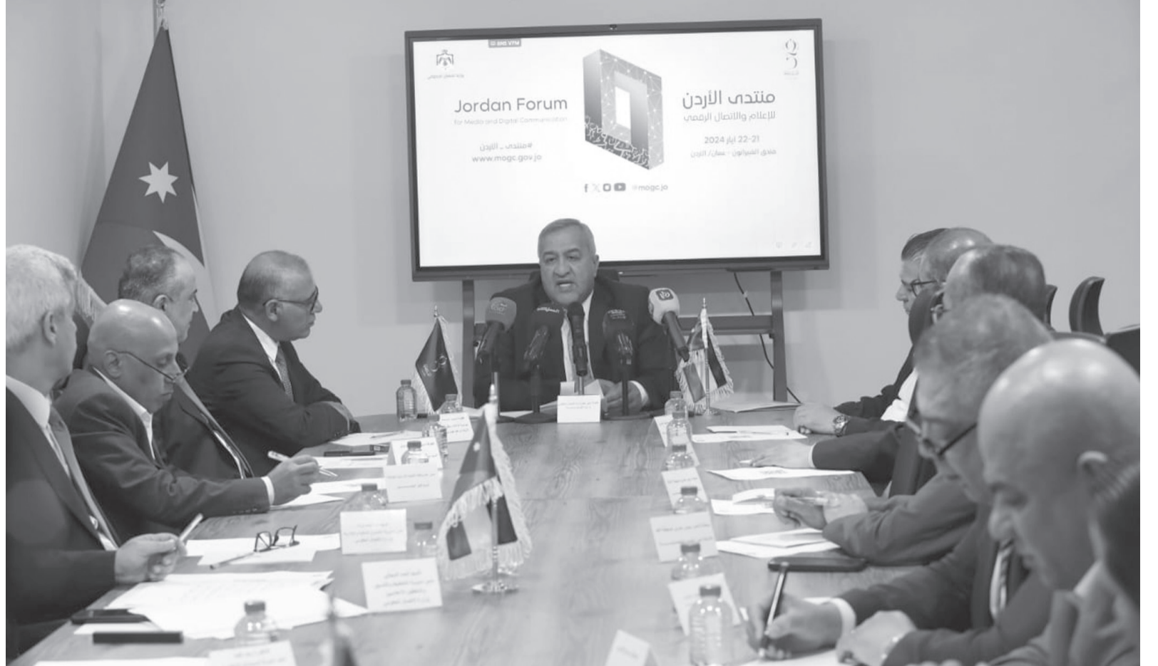
الأبطال - عمان

أعلن أمين عام وزارة الاتصال الحكومي الدكتور زيد النوايسة أن الوزارة ستتنظم منتدى الأردن للإعلام والاتصال الرقمي في الحادي والعشرين إلى الثاني والعشرين من الشهر الحالي في العاصمة عمان، تحت رعاية رئيس الوزراء الدكتور بشر الخصاونة.