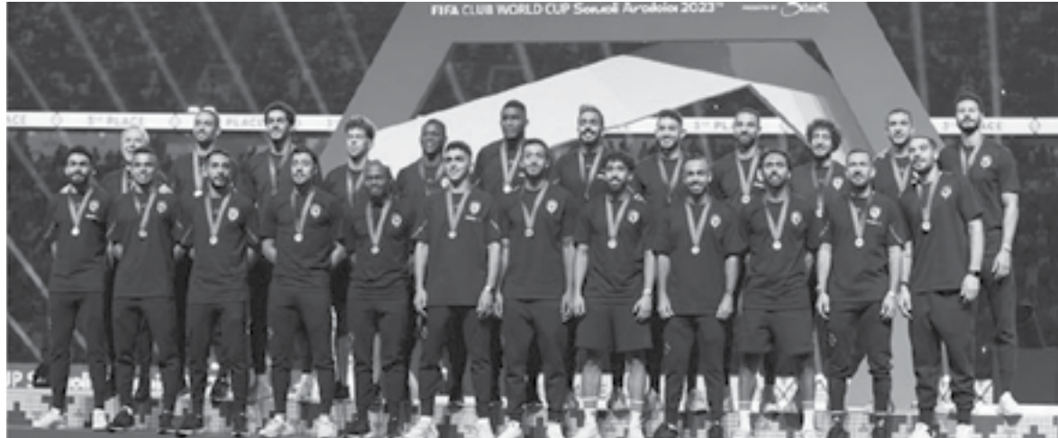
القاهرة - وكالات

على التقاط صورة تذكارية مع المدرب بيب جوارديولا، فيما تحدث الفرنسي موديست مع حارس السيتي ستيفان أورتيغا على هامش التكريم أيضا.