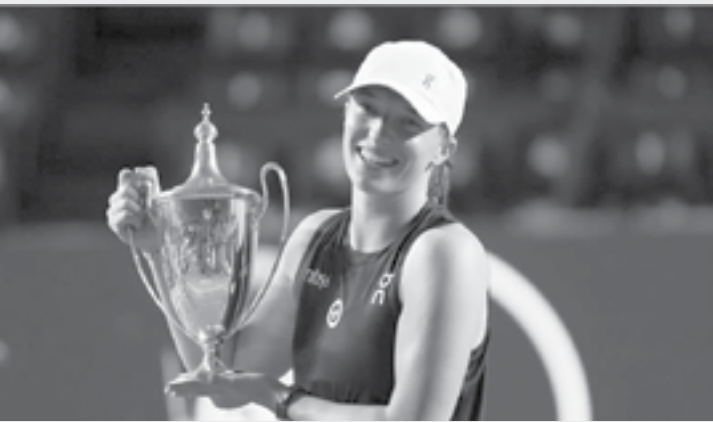
روسيا - وكالات

وVictoria's Secret. وتحتل ٨ لاعبات تنس أخريات المراكز التالية في قائمة العشر الأوائل: الأمريكية كوكو جوف (٢١,٧ مليون)، والبريطانية إيمّا رادوكانو (١٥,٢) واليابانية نغومي أوساكا (١٥) مليوناً، جميعهم خارج اللعب لأنها كانت بعيدة عن الملاعب بسبب الحمل والولادة)، والبيلاروسية أرينا سابالينكا (١٤,٧)، والأمريكيتان جيسيكا بيغولا (١٢,٥)، وفينوس ويليامز (١٢,٢)، رغم مشاركتهما في بطولات قليلة جدا)، والكازاخية إيلينا ريبياكينا (٩,٥)، والكندية ليلي فيرنانديز (٨,٨)، وضمن المراكز العشرين الأولى، جاءت أيضا ثلاث لاعبات تنس أخريات: الصينية كينوين تشانج في المركز الخامس عشر بـ ٧,٢ ملايين دولار، التونسية أسن جابر في المرتبة الثامنة عشر (٥,٧ ملايين)، ومراكيتا فونروسوفا في المركز العشرين (٥,٢). وتبرز أيضا في القائمة لاعبة كرة القدم الأمريكية المعتزلة، ميجان رابينو، التي حلت في المركز الحادي عشر بـ ٨,٢ ملايين دولار.