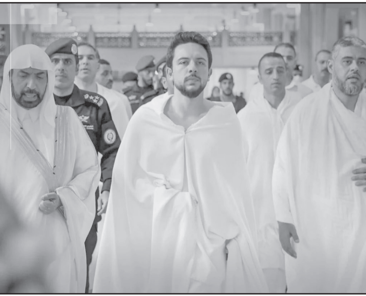
الانباط- مكة المكرمة

وتناول سمو ولي العهد الإفطار مع مجموعة من المعتمرين الأردنيين ضمن بعثة سموه لأداء مناسك العمرة. ووصل سموه لمدينة جدة اليوم، وكان في استقباله بمطار الملك عبدالعزيز الدولي، سمو الأمير بدر بن سلطان بن عبدالعزيز آل سعود نائب أمير منطقة مكة المكرمة.