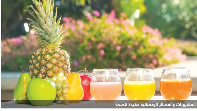
المشروبات والعصائر الرمضانية مفيدة للصحة