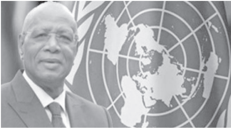
الانباط – وكالات

دعا الممثل الخاص للأمين العام للأمم المتحدة لدى ليبيا، عبد الله باتيلي، السلطات الليبية إلى تجديد الالتزام بالدعم الكامل لتنفيذ اتفاق وقف إطلاق النار في ليبيا الموقع عام ٢٠٢٠، وذلك في ختام اجتماعات اللجنة العسكرية المشتركة (٥٠٥) في سرت يوم أمس الاثنين، مطالبا الحكومة بتخصيص الموارد المناسبة وتكثيف الجهود السياسية لإنهاء حالة الانسداد السياسي، وإعادة الشرعية للمؤسسات الليبية عبر الانتخابات.