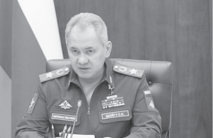
الانباط – وكالات

أوضح شويغو أن "هذه التغييرات واسعة النطاق في تكوين القوات المسلحة وزيادة أعدادها وتغيير التقسيم العسكري الإداري لروسيا، ستستلزم من جميع نواب الوزراء والقادة الحاميين بجميع قطاعات القوات المسلحة وقادة قوات المناطق العسكرية والأسطول الشمالي وفروع القوات المسلحة، اتخاذ القرارات المناسبة ذات الصلة لتعزيز القدرات القتالية للقوات البحرية والجوية والقوات الاستراتيجية".