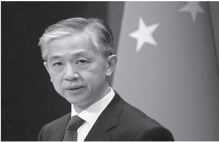
الانباط – وكالات

جهدت الصين مطالبتها الولايات المتحدة واليابان بالتخلي عن عقلية الحرب الباردة، ومحاولتهما احتواء الصين والاضطلاع عوضاً عن ذلك بالتزاماتهما بحسن نية لنزع السلاح النووي. وكانت واشنطن أصدرت مؤخراً بياناً مشتركاً مع طوكيو زعماً خلاله أن "منطقة المحيطين الهندي والهادئ تواجه تحديات متزايدة"، وأقتا بالوم في ذلك على بكين، وأعلنتا عن "الالتزام بتعزيز التحالف العسكري بينهما".