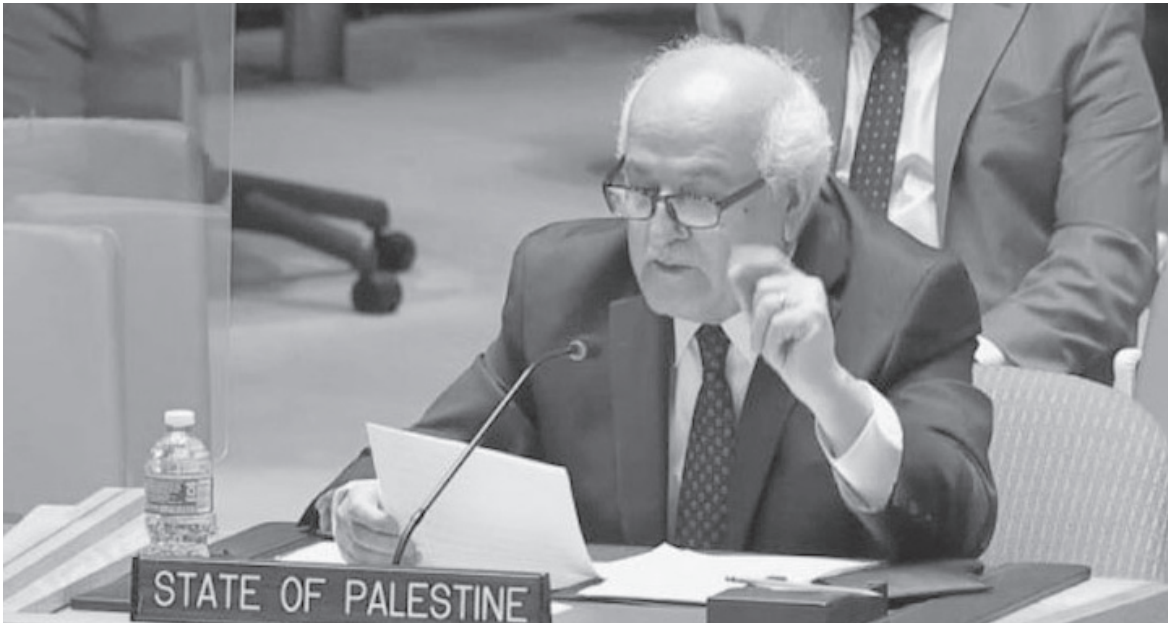
الانباط – وكالات

وذكرت وكالة وفا أن ٤٠ دولة عضواً في الأمم المتحدة أكدت في بيان تم توزيعه على الصحفيين الليلة الماضية دعمها الراسخ لمحكمة العدل الدولية، والقانون الدولي، بوصفه حجر الزاوية للنظام الدولي، وقالت: بمعزل عن موقف كل دولة حول قرار الجمعية العامة نرفض الإجراءات العقابية رداً على طلب رأي استشاري من محكمة العدل الدولية أو