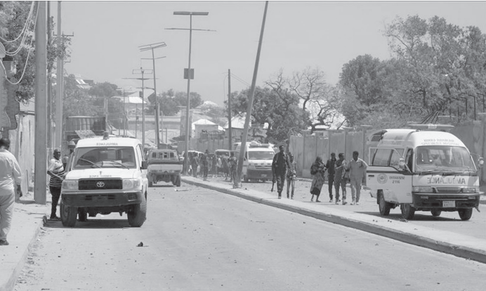
الانباط – وكالات

الجيش ويذكر أبشر محمد محمود". وأفاد بأن الجيش يواصل عملياته في محيط البلدة التي شهدت الهجوم لطاردة الإرهابيين. أعلنت "الشباب" في بيان، أنها قتلت ٦٣ عسكريا خلال الهجوم الانتحاري الذي نفذته عناصر الحركة المتردة. وقال رئيس الأركان في الجيش الصومالي أدوا يوسف راغي، الثلاثاء، إن "الجيش تصدى للهجوم الذي شنه مقاتلو الشباب على مركز عسكري حكومي في بلدة حوادي" في إقليم شبيلى الوسطى جنوبي البلاد. وأضاف لإذاعة مقديشو الحكومية، أن "الجيش تمكن من دحر الإرهابيين الذين شنوا هجوما مباغتاً على المركز"، مشيراً إلى "قتل ٢١ من مقاتلي الشباب وإصابة آخرين بجروح متفاوتة". وذكر راغي أن "ه من القوات الحكومية سقطوا خلال الهجوم الذي شهدته البلدة بينهم ضابط رفيع في