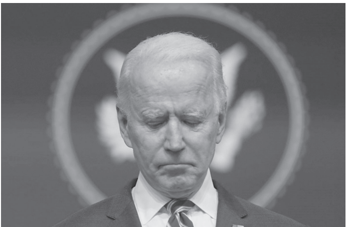
الانباط – وكالات

الوثائق في عدة أماكن. ویرسلونها إلى وزارة العدل الأميركية. وتحقق وزارة العدل الأميركية في كيفية وصول وثائق سرية تعود للفترة التي كان فيها بايدن نائباً للرئيس الأميركي باراك أوباما في منزل بايدن، مما يثير الشكوك حول سمعته. من جهته، استعد بايدن للتعاون الكامل مع القضاء في ملف الوثائق السرية. واعتبرت القضية الثانية بعد فضيحة الكبري للرئيس السابق دونالد ترامب واستخدامه وثائق سرية تخص الدولة، وتشكل القضايا إخراجاً للبيت الأبيض.