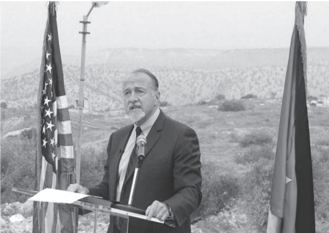
الانباط – عمان

كجزء من برنامج المساعدات الاقتصادية الأميركية للحكومة الأردنية، ضمن مذكرة التفاهم الثالثة بين الجانبين للاعوام ٢٠١٨-٢٠٢٢. وقال السفير الأميركي إن هذا التحويل المالي إلى الحكومة الأردنية يؤكد استمرار التزام الولايات المتحدة بشراكتنا التي تمتد على مدى سبعة عقود مبينا أن الأردن اكبر متلقي للمساعدات الأميركية. وأوضح أن اتفاقية وتحويل اليوم هو آخر تحويل بموجب مذكرة التفاهم لعام ٢٠١٨ والتي، عند دمجها مع مذكرة التفاهم الجديدة التي وقعتها حكومتنا