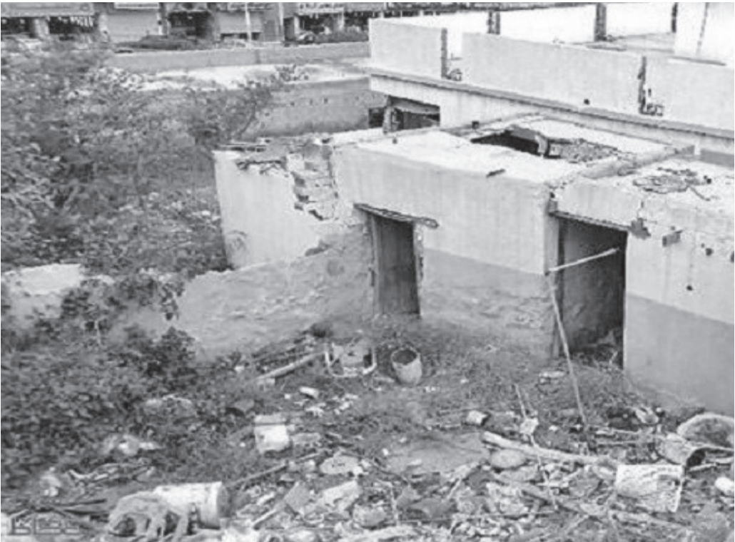
الأنباط – نزار البطاينة

إشكى عدد من المواطنين لـ “الأنباط” في عدة مناطق مختلفة من العاصمة عمان عن وجود مباني مهجورة بـ القرب من منازلهم، موضحين ان هذه المباني المهجورة باتت تشكل مصدر قلق لهم خاصة ممن يسكنون بـ القرب منها، نظرا لانها أصبحت تعد وكرا لأصحاب السوابق، فضلا عن أنها تشكل مكروهة صحية، وفقا لهم. وتابعوا في حديث لهم مع ” الأنباط “، أن أمانة عمان لم تعد تكثرث لهذه المباني، مشيرين إلى أن الرقابة بهذا الخصوص شبه معدومة، وخاصة أنها لا تعد سكنية لأن مساحة الأرض التي تبني عليها هذه المباني لا تتجاوز الـ(100) متر. ”الأمانة“ وفي وقت سابق، أعلنت عن نيّتها التعاون مع الجهات المختصة بهدف عمل حملات لـ إزالة المباني المهجورة، إلا انه ولغاية اللحظة لا يزال عدد كبير من هذه المباني قائم بدون أي تحرك من الامانة، الامر الذي أزعج الكثير من المواطنين وجعلهم يتساءلون عن سبب التأخر في تنفي هذه المعالجات.