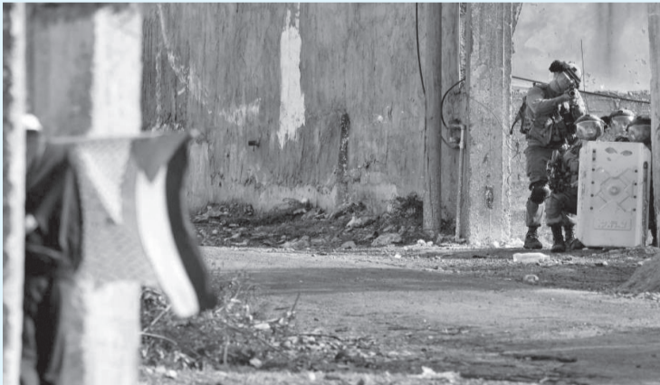
طفيف عن الأسبوع السابق)

وقد بلغ إجمالي اعتداءات قوات الاحتلال والمستوطنين ٢٢١ اعتداء، شملت ٥٠ اعتداء في القدس، و١٥٤ اعتداء في الضفة الغربية، و٧٠ اعتداء في المناطق المحتلة عام ٤٨ أحدها في حيفا وآخر في كفر قاسم وه اعتداءات في النقب، و١٠ اعتداءات شملت مختلف محافظات قطاع غزة