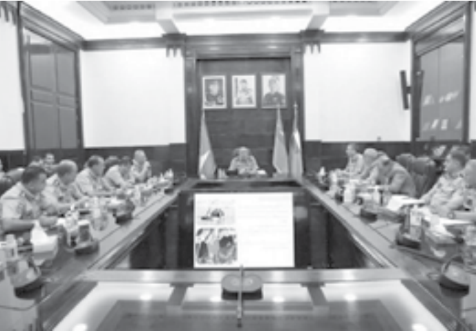
الانباط – عمان

الإسعاف والإنقاذ، وتوفير أحدث الأجهزة والمعدات، وتعزيز قدرات العاملين وتأهيلهم في مختلف التخصصات وفق برامج تدريبية متقدمة تمكّنهم من أداء واجباتهم النبيلة بأفضل الأساليب. كما أوعز اللواء المعاينة بالبدء بتنفيذ خطة للتوسع في فرق البحث والإنقاذ وفرق التعامل مع المواد الخطرة، لضمان تغطيتها لكافة المحافظات بذات الفاعلية، مشيراً إلى ضرورة البناء على ما تحقّق من إنجاز في خفض زمن الاستجابة، وتحسينه، لما في ذلك من أثر في إنقاذ الأرواح التي تكون بأمنس الحاجة لخدمات الإسعاف والإنقاذ .