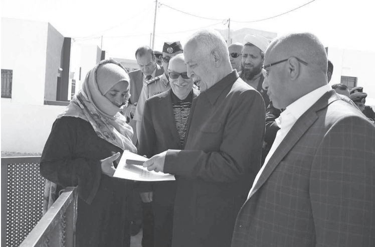
الانباط –الطفيلة – معان

يشار في هذا الصدد إلى أنه، وتحقيقا للرؤية الملكية في توفير الرعاية الصحية للمواطنين، تم صيانة وتوسعة وتأهيل العديد من المستشفيات وتزويدها بالأجهزة والمعدات الطبية اللازمة، فضلا عن إنشاء وتوسعة مراكز صحية.