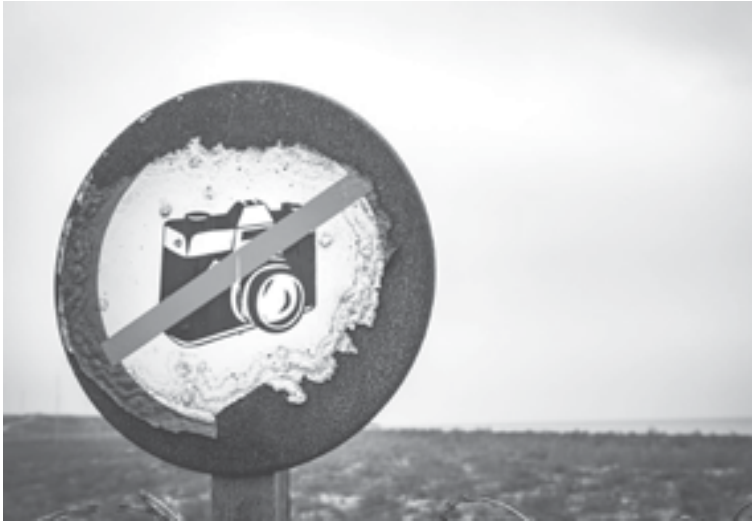
الانباط- شذى حتاملة

تتسارع وسائل الاعلام عند وقوع الحوادث والكوارث الطبيعية بالتركيز على نشر صور اطفال باوضاع وحالات متعددة دون مراعاة للضوابط الاخلاقية والاعلامية واحترام خصوصياته،ووضعهم النفسي.