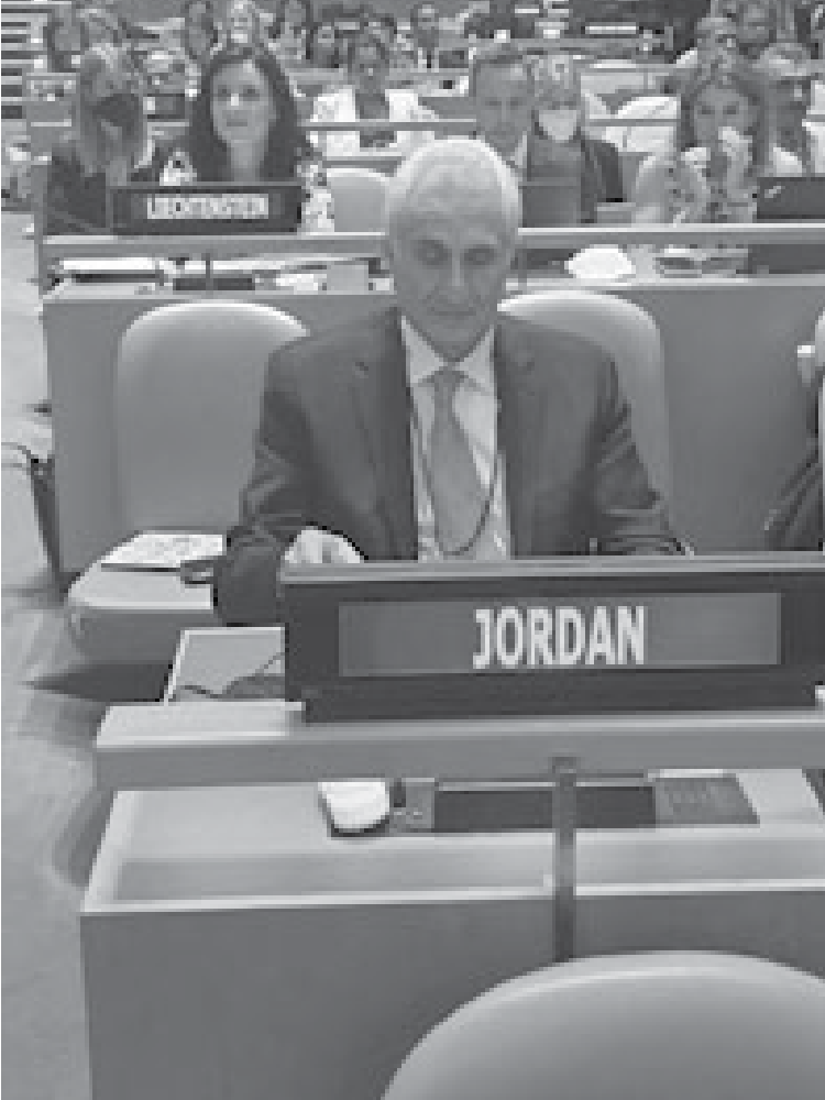
الانباط - نيويورك

وأكد المتحدثون والمشاركون في الجلسة أن هذا المؤشر سيعزز الثقة في أداء تلك المؤسسات، ويسهم في تفعيل القيم والقواعد السلوكية والارتقاء بجودة خدماتها، وسيدفعها إلى التنافس الإيجابي، والارتقاء بأدائها وتطبيق إجراءات عملها بشفافية ونزاهة.