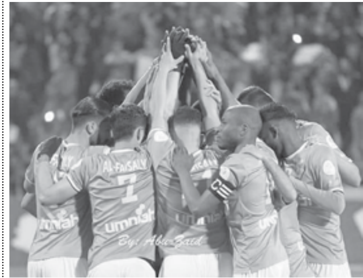
الانباط – عمان

الفيصلي بحضور مباراة الفريق في الجولة 17 أمام السلط. وسعى النادي الفيصلي إلى استئناف العقوبة بحيث يتم خفضها إلى حرمان جواهيره لمباراة واحدة إلا أنه تم رفض ذلك. ووفقا لما سبق فإن مواجهة المرتقبة التي ستجمع الفيصلي مع الحسين إريد في الأول من تشرين الأول / أكتوبر المقبل ضمن الجولة 18 لبطولة دوري المحترفين ستقام بدون جماهير أيضا. ويتصدر فريق الفيصلي والوحدات ترتيب دوري المحترفين ولكل منهما 40 نقطة يليهما الحسين إريد ب 38 نقطة.