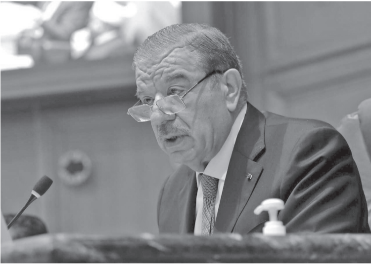
وبخاصة كوادر الدفاع المدني والأمن العام، الذين تعاملوا مع الحدث الفجع،