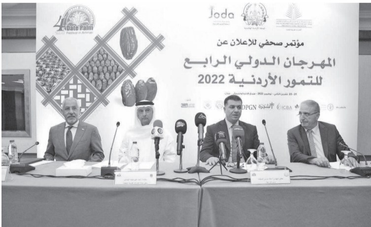
الانباط – عمان

وأوروبا، ويعد هذا القطاع ريادياً جاذباً للاستثمار، ويعدم توفير فرص العمل ورفع قيمة الصادرات الزراعية. وأشاد الحنيفات بدعم سمو الشيخ منصور، وبجهود الأمانة العامة لجائزة خليفة الدولية لنخيل التمر والابتكار الزراعي في تنظيم هذا المهرجان، مؤكداً عمق العلاقات التاريخية بين المملكة ودولة الإمارات العربية المتحدة.