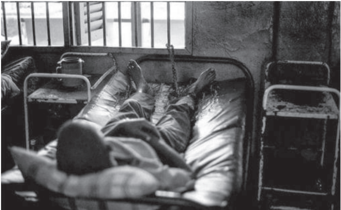
الانباط – وكالات

نابلس، والذي خضع سابقا لعملية جراحية لتوضع بلاتين، تميل إلى الاستمرار وهذا يتطلب التعامل مع حالته بجدية، حتى لا يدخل في أي انتكاسة جديدة، وأنه قد يخضع لإجراء عملية أخرى لنزع البلاتين مستقبلا، ووضع مفصل مكان الإصابة بالحوض