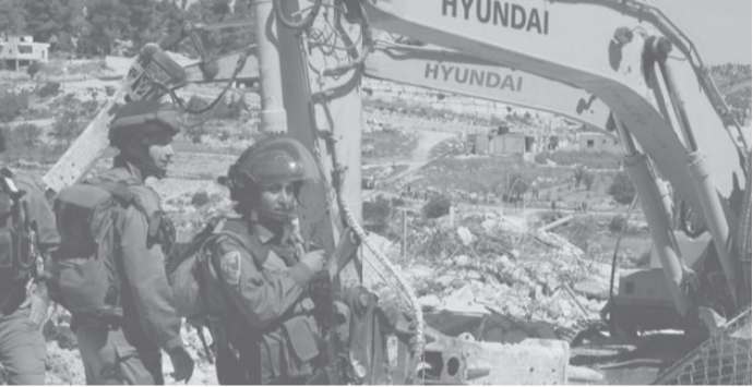
الانباط – وكالات

غسان دغلس لوكالة وفا بأن قوات الاحتلال اقتحمت منطقة الضحاك جنوب شرق قرية روجيب في نابلس بعدد من الجرافات وهدمت منزلا واقتلعت عشرين شجرة زيتون واقتحمت قوات الاحتلال أحد أحياء مدينة اللد بالأراضي المحتلة ١٩٤٨ وهدمت منزلين