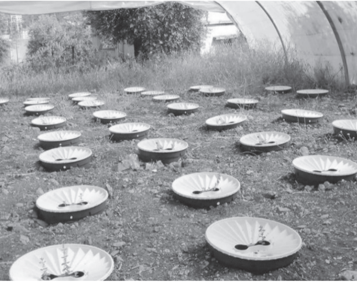
الانبط – وكالات

بمرشححه محمد شياع السوداني لمنصب رئيس الوزراء المرفوض من الصديرين جملةً وتقصيلاً ويعتبرونه ظلاً لرئيس الوزراء السابق نوري المالكي، ما يعني أن سيناريو تشكيل الحكومة الجديدة من التحالف الموالي لطهران بات احتمالاً ضعيفاً جداً ثمة سيناريو آخر محتمل إذا فشلت مساعي الوفد الثلاثي في إقناع الصدر بالاشتراك في الحكومة المقترحة؛ فإنه ليس من المستبعد أن يعاود الطرفان بعد انتهاء الزيارة الأربعينية يوم (الجمعة) ١٦ سبتمبر استخدام ورقة الشارع مجدداً والتي قد تؤدي إلى تجدد الاشتباكات المسلحة فيما بينهما مثلما حصل يومي ٢٩ و ٣٠ أغسطس أثناء اقتحام المنطقة الخضراء والتي يبدو أن الصراع يتمحور حول من سيسيطر عليها، لهذا بدأ العمل من قبل أمن الحشد الشعبي (المقرب من نوري المالكي) في إقامة بوابات حديدية على جسري الجمهورية والسنك المؤديان للمنطقة الخضراء