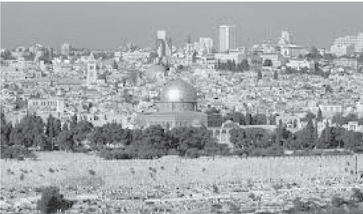
الانباط – وكالات

نقلت القناة ١٢ الصهيونية أن حكومة الاحتلال عقدت اجتماعاً أمنياً مساء أمس الثلاثاء بمشاركة رئيس الوزراء الصهيوني يائير لابيد لتقييم الأوضاع الأمنية قبل موسم الأعياد اليهودية الطويل، وأن الاجتماع قرر المهضي قدما بالسماح باقتحامات المستوطنين للمسجد الأقصى المبارك