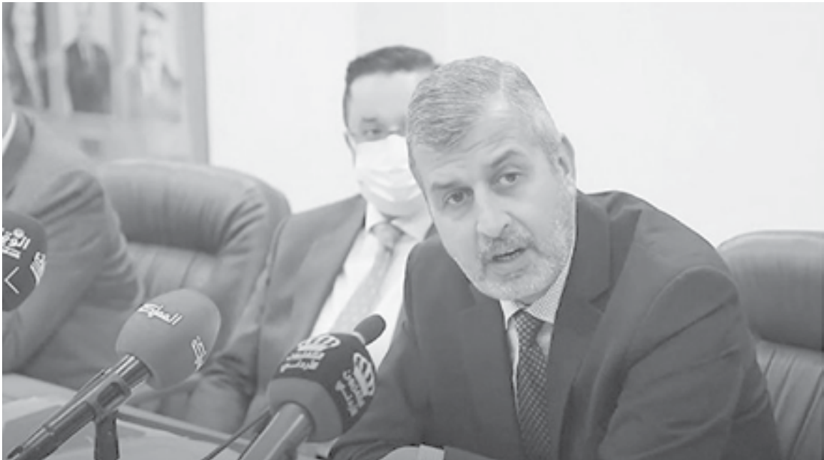
الأنباط - عمرا الكعابنة

استخدامها لإنتاج الهيدروجين الأخضر الذي يعد وقود المستقبل ، موضحا أن الوزارة طرحت هذه الفكرة على العديد من الدول للوصول لتوافقات من نجاح هذه العملية..