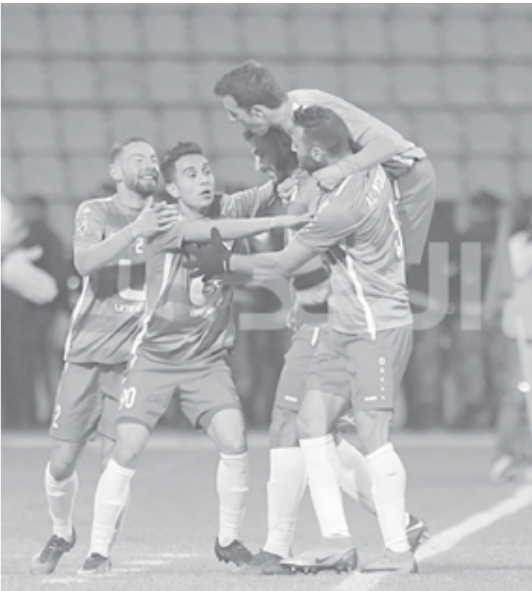
الانبطاط - عمان

تنتطلق مساء اليوم الخميس منافسات لاسبوع التاسع من دوري كرة القدم لنادية لبحرتهين بإقامة مبارياتهن حيث يلتقي الأولى الجزيرة مع مغير السرحان عند الساعة مساء على ستاد عمان الدولي، فيما يستقبل الوحدات ضيفه الصريح، عند الثامنة والنصف مساء على ستاد الملك عبدالله الثاني القوسية .. في المباراة الأولى يرمي فريق الجزيرة بكافة أوضاعه الفنية من أجل ضمان الفوز على ضيفه الواعد والوفاة الجديد مغير السرحان بهدف الانتقال خطوة نحو لمام جنبا للمركز المتأخر الذي يتبع به الفريق والذي لا يتناسب مع تاريخه وواقعته في المقابل يسعى فريق السرحان إلى مواصلة عروضه القوية أمام فرق المقدمة وتحقيق الفوز الذي يضعه قريبا من المقدمة بعد الفوز الكبير الذي حققه قبل أيام على فريق عمان .. ويضعه الفريقان في تحقيق الفوز وتحسين موقعهما على سلم الترتيب، حيث يستقر فريق الجزيرة بالمركز قبل الأخير بـ6 نقاط، تعادل الجزيرة في الجولة الماضية مع الحسين بـ (2-2) وكان قريبا من الفوز، وهو يتطلع لحصد الثلاث النقاط للارتفاع من المنطقة الخطر في المقابل، قبل مغير السرحان يسعى لواصله نتائجه الممتدة، حيث سجل في