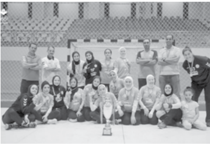
الانبط - عمان

الأول مستغلاً إيقاف لاعبين من نادي وادي السير ليهيئ الشوط لصالح بفاق ؛ أهداف ونتيجة ٨-٢. وواصل نادي حرثاً أفضليته في الشوط الثاني ليحسم اللقاء لصالحه بنتيجة ٢١-١٧. وكان نادي حرثاً قد تأهل للشهيد النهائي للبطولة بعد فوزه في الدور الأول على نادي البتراء بنتيجة ٣٥-١٥. وفي نصف النهائي فاز على نادي كفسروم بنتيجة ٣١-١٨. فيما كان نادي وادي السير في التأهل النهائي للمرة الأولى في تاريخه بعد فوزه بمبارتين على كل من، نادي الفجر بنتيجة ٢٩-١٦ و نادي عمان بنتيجة ٢٨-٢٥.