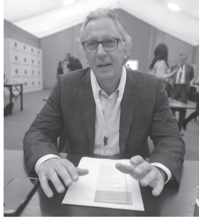
تمتوى ويشغل الأيدي العاملة ويرفد الخزينة بالعملة الصعبة . ولفت فخر الدين أن الحل لتردي الوضع الاقتصادي في الاردن يكمن في التركيز على