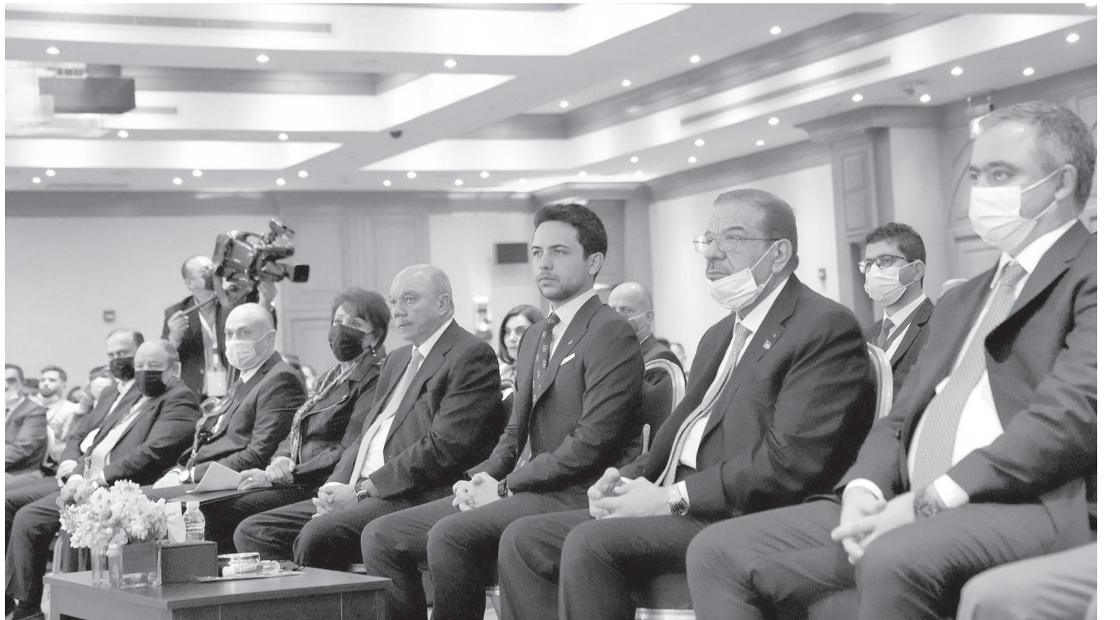
الانباط- البحر الميت

رعى سمو الأمير الحسين بن عبدالله الثاني، ولي العهد، امس الأحد، حفل افتتاح المؤتمر الحواري الوطني الشبابي الأول، الذي تنظمه لجنة مبادرة الحوار الوطني الشبابي في مجلس الأعيان.