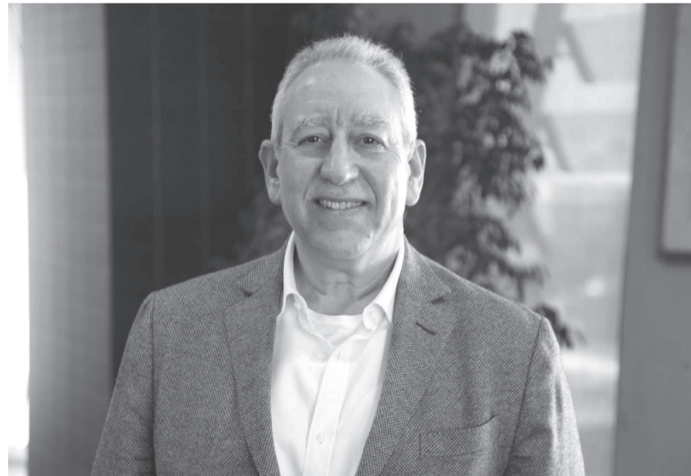
66.4 مليون دينار مغارة 66.4 مليون عام وأوضح أن الخسائر التي سجلها الناقل الوطني جاءت نتيجة استمرار تأثير تبعات

تراجعت خسائر شركة الخطوط الجوية الملكية الأردنية بواقع 86.8 مليون العام الماضي مسجلة انخفاضاً بنسبة 54 بالمئة مقارنة بالعام 2020.