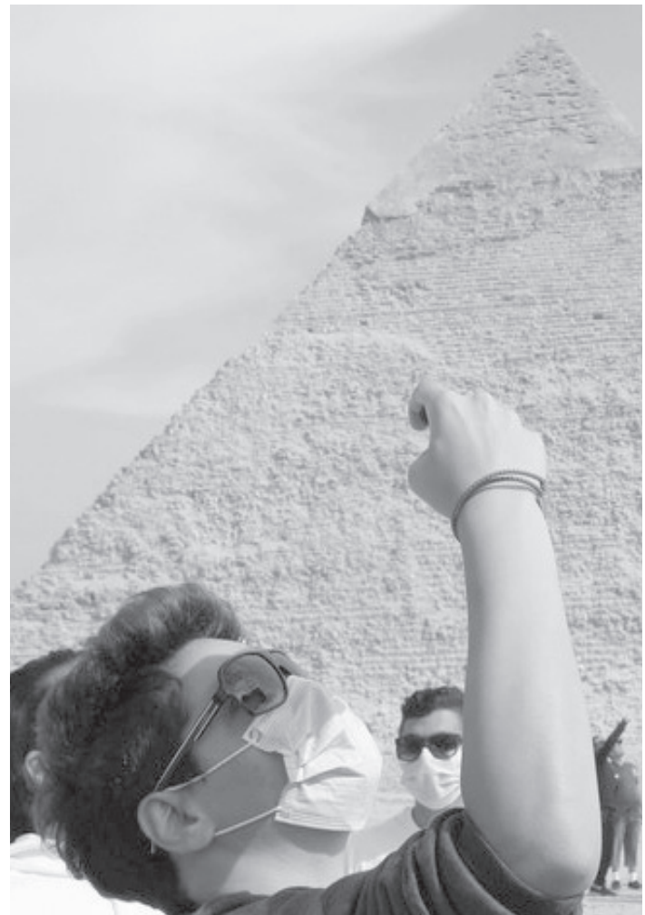
القاهرة – رويترز

وكانت نائبة الوزير قد ذكرت في تصريحات سابقة أن إيرادات مصر السياحية خلال النصف الأول من العام الماضي تراوحت بين ٣,٥ و٤ مليارات دولار. وتسهم السياحة بما يصل إلى ١٥% من الناتج الاقتصادي لمصر، وهي مصدر رئيسي للنقد الأجنبي. وبحسب بيانات البنك المركزي المصري، فإن قطاع السياحة المصري، والذي كان يسهم بنحو ١٢% من الناتج المحلي الإجمالي قبل الجائحة، شهد المزيد من التعافي خلال ٢٠٢١ مع عودة حركة السفر الدولية، لترتفع الإيرادات بنحو ٢٠% في النصف الأول من ٢٠٢١ مقارنة بالعام السابق. ومن المتوقع أن تصل عائدات السياحة الدولية إلى قيمة تتراوح بين ٧٠٠ و٨٠٠ مليار دولار في عام ٢٠٢١، وتقدر المساهمة الاقتصادية في سيناء ومنتجج الجلالة على شاطئ البحر الأحمر ونمو الفنادق في مدينة العلمين بما ينتج عنه منتجات سياحية جديدة ترفع من تنافسية مصر السياحية..