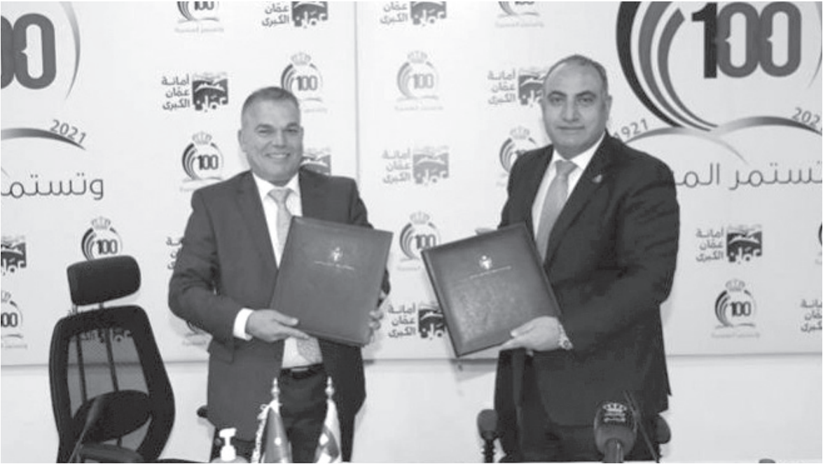
الانباط – عمان

٤٠ عاماً، خاصة وأن جميع الأردنيين تواقون إلى رؤية المشروع على أرض الواقع ورؤية الحل الجذري لهذا الموقع البيئي الحرج، مشمنا جهود شركاء الأمانة وفريق عمل الأمانة الحثيثة في تصميمه والعمل على إخراجِه إلى أرض الواقع. كما ثمن رئيس الائتلاف، جهود أمانة عمان والبنك الأوروبي لإعادة الإعمار والتنمية، في تنفيذ مشروع إعادة تأهيل بركة البيبسي، مشيرا إلى أنه سيتم تنفيذ المشروع وفق أفضل المعايير والمواصفات الدولية والبيئية. وتتضمن المرحلة الأولى من المشروع، معالجة الوضع البيئي القائم والتخلص من المياه الراكدة