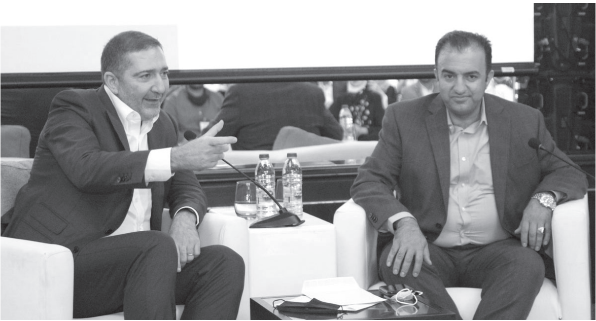
الانباط – عمان