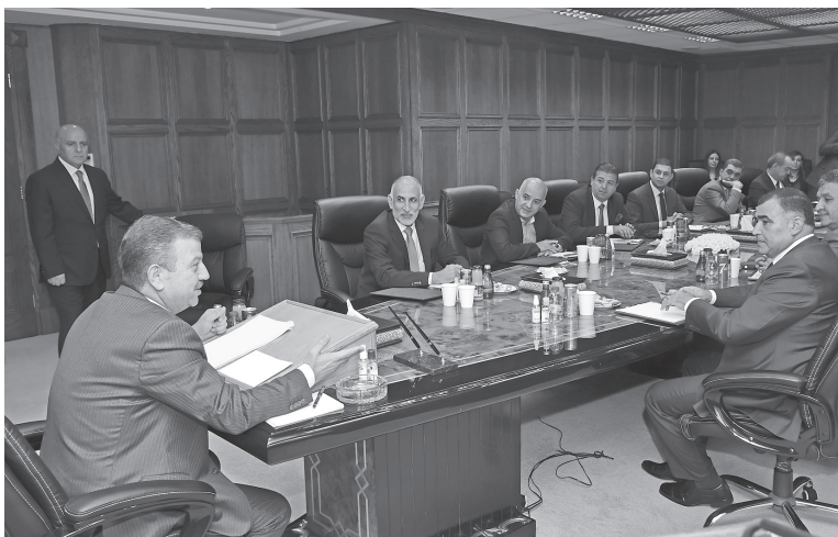
النامعة في مفهوم الامن الشامل.