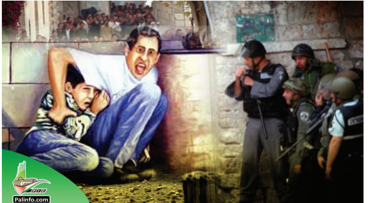
الاحتلال الذي تناساه العالم

طلقة في رجله اليمنى وصرخ: أصابوني الكلاب، فوجئ الأب بعد ذلك بخروج الرصاص من ظهر محمد الصغير ردد قبيل استشهاد: اطمنن يا أبي أنا بخير لا تخف منهم، رقد الطفل شهيداً على ساق أبيه، في مشهد أبكى البشرية وهز ضمائر الإنسانية انتفاضة الأقصى واندلعت شرارة انتفاضة الأقصى، يوم ٢٨ من سبتمبر/أيلول عام ٢٠٠٠، لتشكل نقطة تحول في مسار القضية الفلسطينية، وقلبت الكثير من التوازنات، وأسست لمرحلة جديدة من التحرير شرارة الانتفاضة أوقدت عقب زيارة استفزازية لزعيم حزب الليكود حينها، شارون و٦ من أعضاء الكنيست الموالين له، بالإضافة لعشرات المستوطنين وقرابة ألفي جندي، وهو ما شكل استفزازاً وتحدياً لمشاعر الفلسطينيين والمسلمين، لتنتقل حينها صرخة المقاومة في باحات الأقصى، وامتدت على إثرها لكل شبر من فلسطين