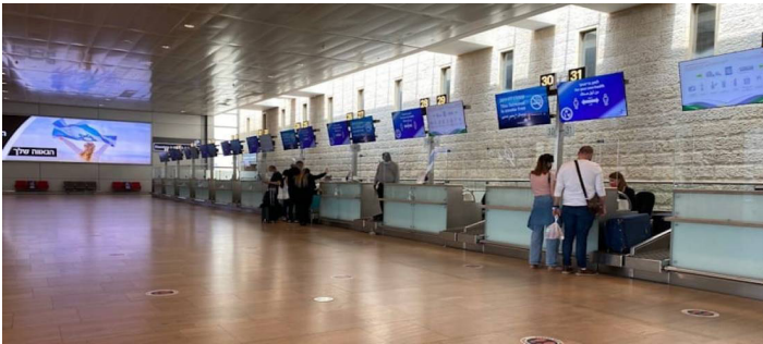
ترجمات عبرية – قُدس الإخبارية

إطلاقها من قطاع غزة، واضطرت الرحلات الجوية المقرر هبوطها التحليق فوق البحر، حتى تم توجيهها للهبوط في مطارات أخرى. كما علقت “إسرائيل” حركة الملاحة الجوية في مطار ”بن غوريون“ وسط فلسطين المحتلة، الثلاثاء، إثر قصف المقاومة الفلسطينية.