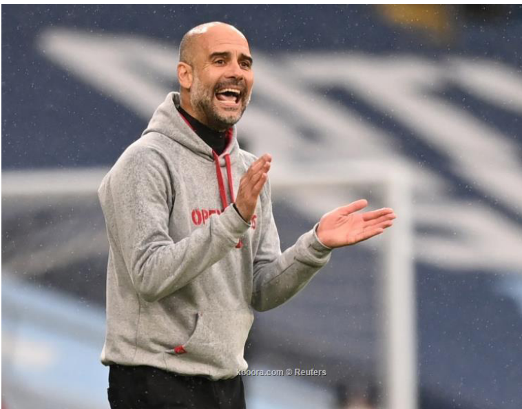
كوبورسكوم © Reuters

كشف تقرير صحفي إيطالي الأربعاء، آخر التطورات المتعلقة بإصابة السويدي زلاتان إبراهيموفيتش، مهاجم ميلان، وفرص لحاقه بما تبقى من هذا الموسم. وتعرض إبراهيموفيتش (٣٩ عاماً) لإصابة في الركبة أمام يوفنتوس، يوم الأحد الماضي، وأشار ستيفانو بيولي، المدير الفني لميلان، إلى احتمالية غيابه عن المباراتين المقبلتين أمام تورينو وكالياري. وبحسب صحيفة «لاجازيتا ديلو سپورت»، الإيطالية، فإن زلاتان إبراهيموفيتش لن يلعب مع ميلان مرة أخرى هذا الموسم، لكنه سيحاول