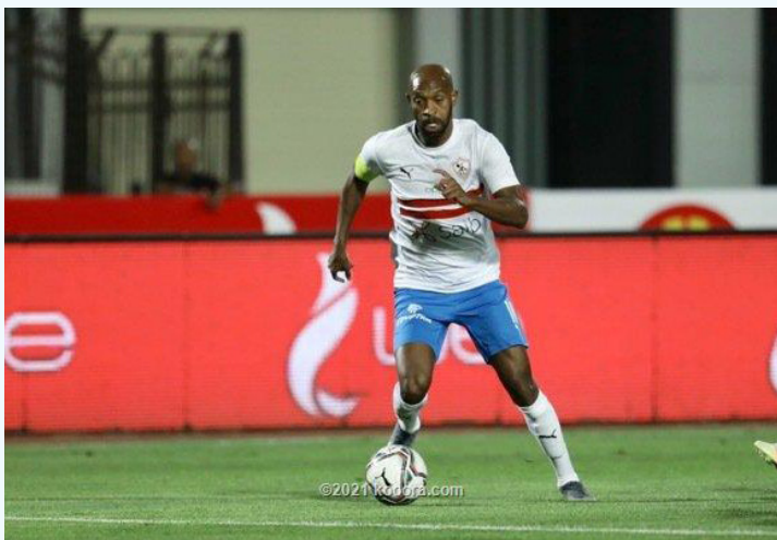
القاهرة - وكالات

الكيل». وتابع «هذا التحرك ليس من أجلي فقط، من أجل حماية كل أصحاب البشرة السمراء من لاعبين ومدرسين، حتى يتم التصدي لهذه الظاهرة العنصرية». ودخل شيكاغابالا في أزمة مكررة مع جمهور الأهلي، خلال القمة في فضل جديد من قصة العداء المستمر بين الطرفين. ورد شيكاغابالا على بعض الحاضرين في مدرجات ستاد القاهرة، من المنتمين للأهلي، أثناء تبديله في الشوط الثاني، حيث أشار لهم صوب حدائه بعد هتافهم ضده.