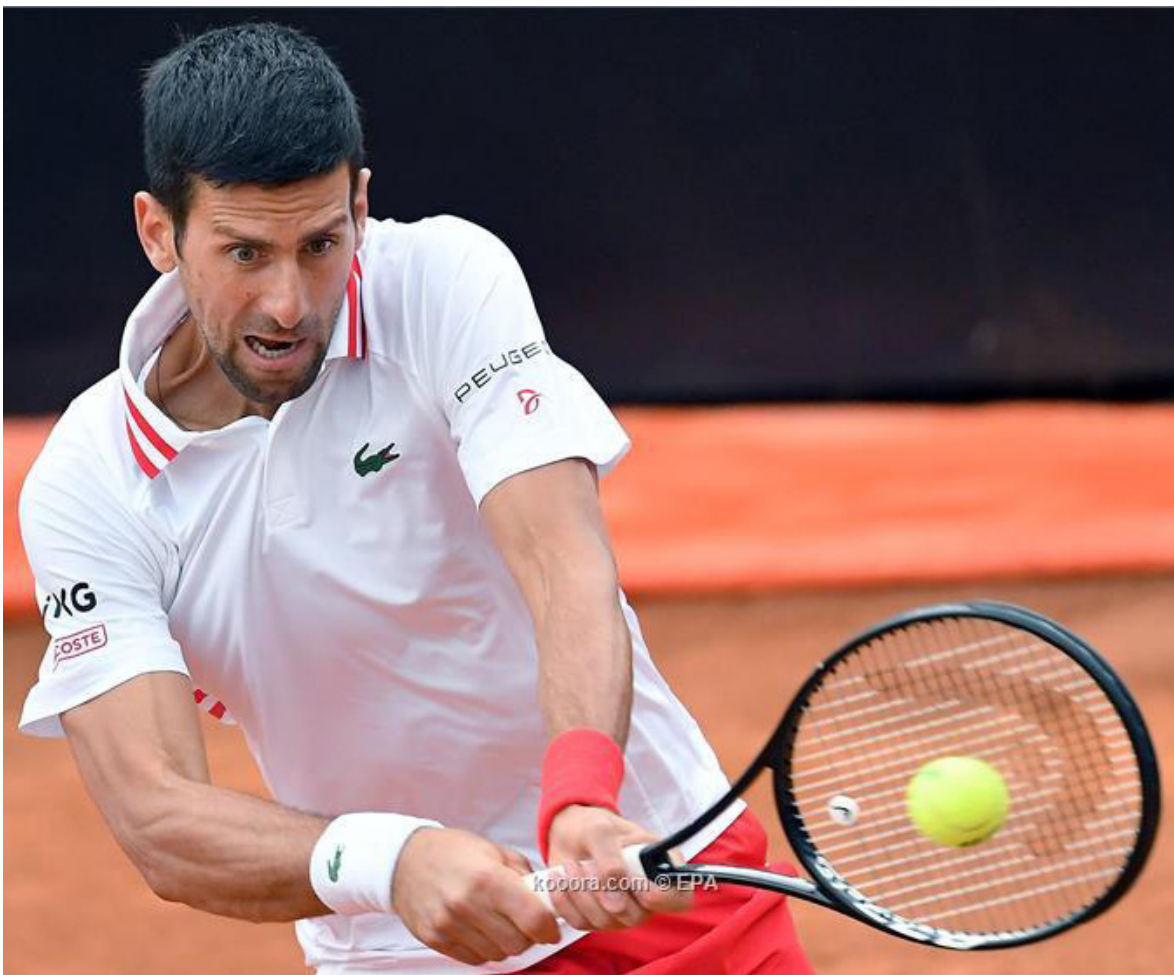
كوبورسكوم © EPA

استشاط نوافك ديوكوفيتش، المصنف الأول عالمياً، غضبا من الحكم لعدم إيقافه اللعب بعد سقوط الأمطار في مباراته بالدور الثاني لبطولة روما للأساسذة للتنس أمام الأمريكي تايلور فريتز. وفقد اللاعب الصربي، البالغ عمره ٣٣ عاماً، أعصابه بعد أن كسر فريتز، ضربة إرساله بينما كان يرسل للفوز في المجموعة الثانية. وصرخ ديوكوفيتش في الحكم ناتشو فوركاديل قائلا «إلى متى سنستمر في اللعب؟ طلبت منك ٣ مرات لكنك لا تفعل شيئاً». وتم إيقاف المباراة في النهاية ٣ ساعات قبل أن يحسم ديوكوفيتش الفوز (٦-٣)، و(٧-٦). وتم إلغاء كل مباريات الرجال الأخرى لهذا اليوم. وقال ديوكوفيتش، إنه عانى كثيرا من الأحوال الجوية قبل أن يتوقف اللعب والنتيجة (٥-٥) في المجموعة الثانية. وأضاف ديوكوفيتش الذي أغمته القرعة من خوض الدور الأول هذا الأسبوع: «لم تكن المرة الأولى وليست الأخيرة التي سأواجه فيها هذه الظروف. رغم خبرتي الكبيرة شعرت بالغضب وفقدت أعصابي. لكنني بخير. في نهاية اليوم خرجت بدروس كبيرة. تعلمت الكثير من الأشياء المهمة من هذا اليوم».