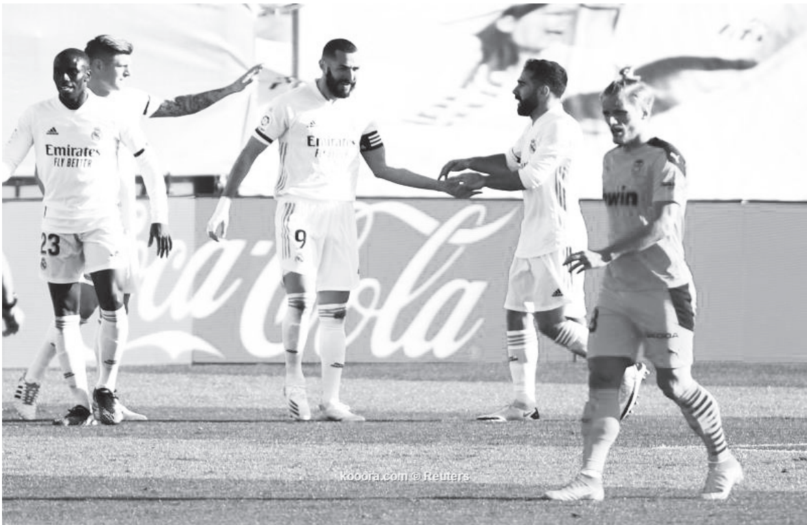
مدير - وكالات

الأبطال، وخسر مباراة واحدة فقط بنتيجة (٣-١) في إياب ربع النهائي أمام يوفنتوس. ولم تمنع هذه الهزيمة ريال مدريد من الوصول إلى النهائي موسم (٢٠١٨-٢٠١٧) في كارديف، نظرا لتفوق الريال في مباراة الذهاب بثلاثية نظيفة. في الواقع، فاز الملكي في آخر ه مباريات، ولم يخسر في إيطاليا منذ ه مايو/أذار ٢٠١٥، حيث خسر امام يوفنتوس في ذهاب