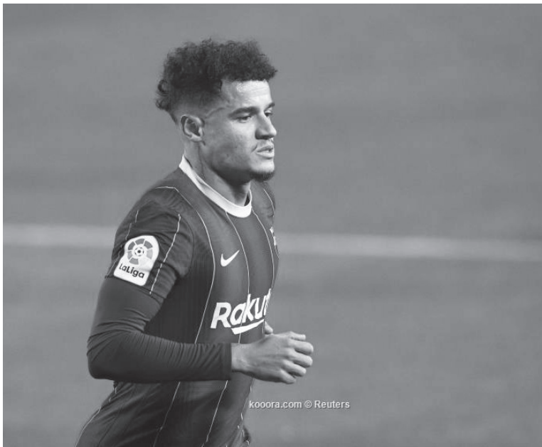
مدير - وكالات

تعرض البرازيلي فيليب كوتينيو، لاعب وسط برشلونة، لانتكاسة جديدة ستؤجل عودته إلى الملاعب. وكان كوتينيو تعرض لإصابة في ركبته اليسرى خلال مواجهة إيبار في الجولة ١٦ من الليجا. وقال برشلونة، عقب الإصابة، إن اللاعب أجرى جراحة ناجحة يوم ٢ يناير/ كانون الثاني الماضي في الغضروف المفصلي الخارجي للركبة، ومدة غيابه ستكون ٣ أشهر. ووفقا