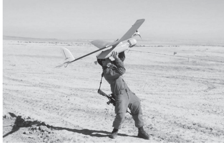
على أنها "أحداث بسيطة، واعتبر أن ما يجري معركة على "حرية الحركة في الأجواء..

الطائرات المسيرة، حسب وصفه. وأضاف: لا يجب أن ينظر لإسقاط الطائرات على أنها غير هامة بسبب سعر الحوامات المنخفض. وكان بوحبوط اعتبر بعد إسقاط المقاومة في قطاع غزة ولبنان لطائرات مسيرة، أن "تعاوننا وتبادلًا للمعلومات بين فصائل المقاومة الفلسطينية واللبنانية"، وغير عن "قلقه من تطور قدرات المقاومة في قطاع غزة". ويعتمد جيش الاحتلال على الطائرات المسيرة بمختلف أنواعها في عمليات الاستطلاع والتجسس، وخلال الحروب والعمليات العسكرية. ويشير إسقاط ثلاثة طائرات مسيرة إسرائيلية خلال يومين، حول مستقبل الصراع بين المقاومة والاحتلال في الجو، وهل تشهد معركة عنوانها الطائرات المسيرة؟