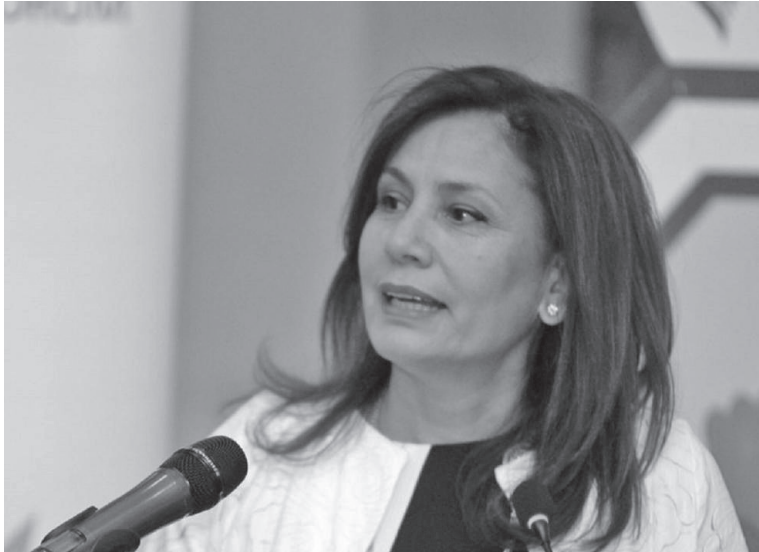
الانباط – عمر الكعبانة

تاريخ 1/5/2018 وكان مشروطا بالتزام المصفاة بمراحل التنفيذ المحددة وفقا للجدول الزمني الذي قدمته مصفافة البترول الاردنية ويخالف ذلك يعتبر الاستثناء ملغي. في حين أكد مصدر خاص لـ“الانباط” أن مجموع المبالغ المطالب دفعها من المصفافة للحكومة عن فرق النوعية ما بين المواصفة الاردنية والمنتج محليا يزيد عن الـ 20 مليون دينار اردني، اذا ما اضفنا الفرق النوعي ايضا لمادة البنزين الذي يباع فقط من خلال محطات شركة جو بترول التابعة لمصفافة البترول الاردنية بقيمة 11 مليون ونصف دينار لمادة الديزل، وحوالي 9 مليون و 400 الف لمادة البنزين.