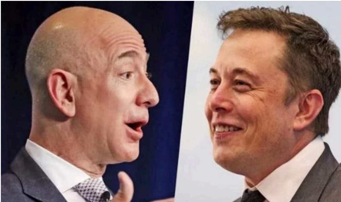
دبي – العربية

كشف تقرير للأمم المتحدة أن الأغنياء الذين يشكلون 1% من البشرية، يضحون أكثر من ضعف كمية الكربون في الغلاف الجوي التي يتسبب بها 50% من الفئات الأفقر.