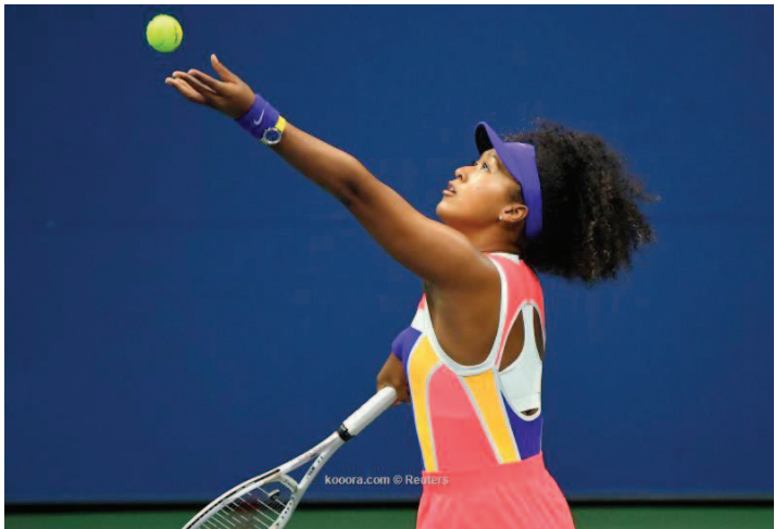
امريكا – وكالات

لكنها لم تقدم ما يدل على إرهاقها وسددت أربع ضربات إرسال ساحة وأجبرت منافستها على ارتكاب ٢٤ خطأ. وقالت اللاعبة البالغ عمرها ٢٢ عاما بعد المباراة "إرسالي كان جيدا حقاً. أنا سعيدة بأسلوبي. أعتقد أنه كان إيجابياً طيلة المباراة.. وواصلت أوساكا، التي أجبرت جورجى على الركض طيلة الوقت، اللعب بإيقاع سريع في مباراة استمرت ساعة وعشر دقائق فقط. وأبلغت أوساكا، الفائزة بلقب أستراليا المفتوحة ٢٠١٩ لكنها لم تعبر الدور الرابع في البطولات الأربع الكبرى منذ ذلك الحين، الصححين أنها تتعامل مع البطولة "كل مباراة على حدة".