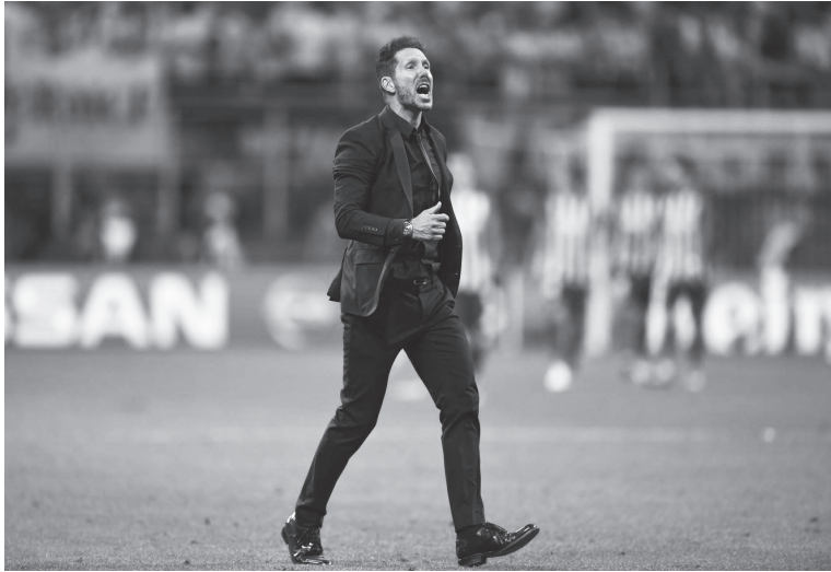
مدريد - عواصم

امتلاكنا لقائمة جيدة. نحتاج لجميع اللاعبين“. وتابع ”رغم رحيل ٨ لاعبين مع بداية الموسم، وانضمام ١٠ لاعبين جدد، ورغم مرور الفريق بفتره انتقالية، إلا أن الجميع يبذل قصارى جهده، واللاعبون يدركون أهداف النادي. ما لم يتغير هو مواصلة البحث عن التطور، بعيداً عن أننا ما زلنا بحاجة للتحسن في جوانب كثيرة“. وحول مواجهة الفريق المرتقبة يوم الثلاثاء المقبل أمام برشلونة على ملعب (الكامب نو)، أوضح ”الفريق بحالة جيدة، واللاعبون يستجيبون بطريقة رائعة. لم أفز مطلقاً على هذا الملعب، ولهذا أتمنى أن نحظى بهذه الفرصة في مواجهة القادمة“. يذكر أن الأتلتي سيفقد اثنين من أعمدته الرئيسية في مباراة البارسا وهما القائد كوكي ريسوركيون والمدافع ستيفان سافيتش، وكليهما للإيقاف بسبب تراكم البطاقات الصفراء.