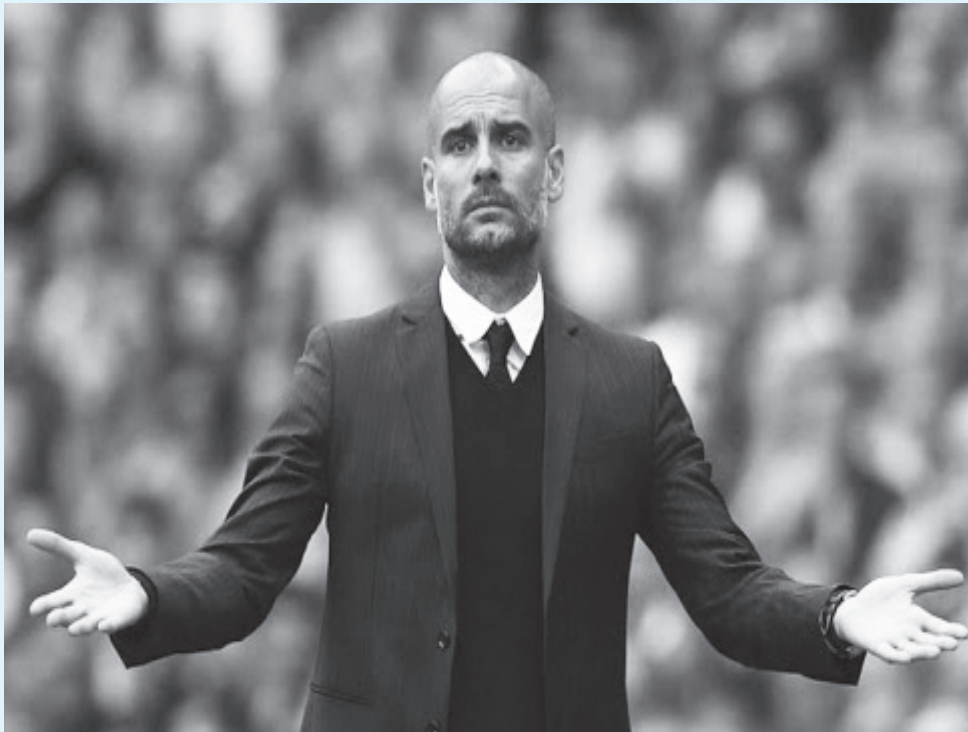
برشلونة - وكالات

ينوي برشلونة، التحرك نحو التعاقد مع الإسباني بيب جوارديولا، مدرب مانشستر سيتي، لقيادة الفريق الكتالوني، الموسم المقبل. ويعيش برشلونة، أسوأ فتراتة في الفترة الأخيرة، وتعاود مرتين في آخر ٣ مواجهات بالليجا، وسيتحرك برشلونة، لإعادة جوارديولا مرة أخرى للكامب نو، بحسب صحيفة ”إكسپريس“ البريطانية، حال فشل السيتي في الاستئناس المقدم محكمة التحكيم الرياضية بشأن عقوبة إيقافه عامين من المشاركة أوروبياً.