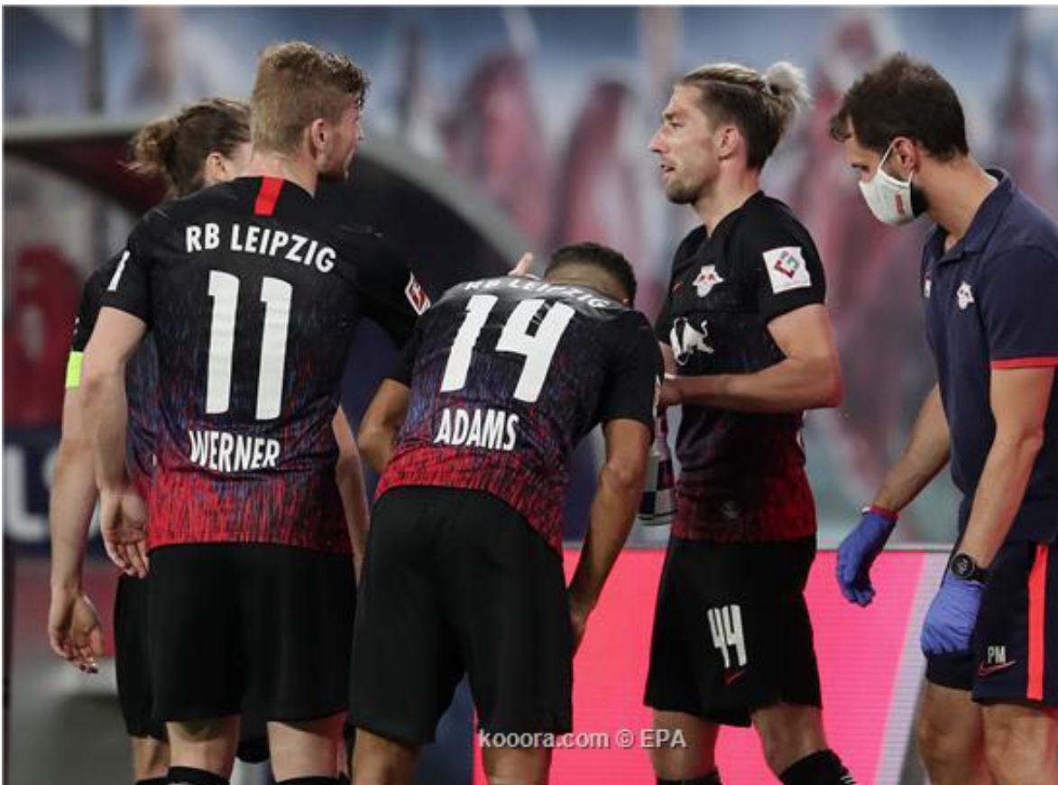
برلين - وكالات

رغم حسم بايرن ميونخ لقب الدوري الألماني (بوندسليجا) قبل مرحلتين على نهاية المسابقة، إلا أن فعاليات المرحلة الثالثة والثلاثين قبل الأخيرة من المسابقة، والتي تقام جميعها اليوم السبت، لا تخلو من المفارعة والإثارة. ويتصارع بوروسيا مونشنجلادباخ وباير ليفركوزن مع فريق لايبزيغ صاحب المركز الثالث على بطاقتي التأهل من البوندسليجا إلى دور المجموعات بدوري أبطال أوروبا للموسم المقبل حيث حسم بايرن وبوروسيا دورتموند البطاقتين الأولى والثانية. وفي المقابل، يتطلع دوسلدورف إلى الهروب من شبح الهبوط ودفع فرق أخرى إلى الهبوط.