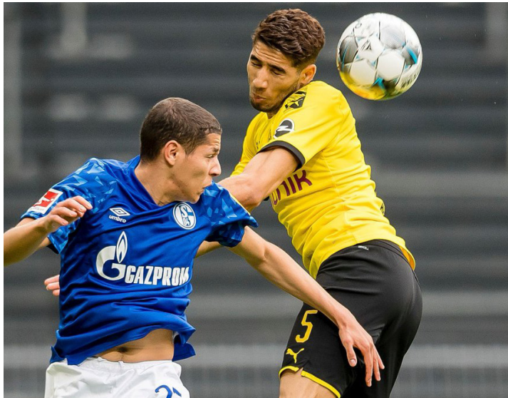
برلين - وكالات

وأسهل حارث في ١٠ أهداف مع الأزرق الملكي، سجل ٦ منها وصنع ٤ أخرى، بينما تفوق عليه مواطنه كيمي بالمشارة في ١٥ هدفاً، حيث أحرز ه أهداف، إلى جانب صناعته ١٠ أخرى. وضعت القائمة أيضاً ثنائي بايرن ميونخ، البولندي روبرت ليفاندوفسكي والألماني سيرجي غنابري، حيث لعبا دوراً مهماً في تنويع الفريق البافاري باللقب الثامن على التوالي. وتواجد الإنجليزي جادون سانشو، جناح دورتموند، رفقة زميله النرويجي إيرلينج هالاند، رغم مشاركة الأخير مع بداية الدور الثاني فقط، لانضمامه إلى أسود الفيسفيل في يناير/كانون ثان الماضي.