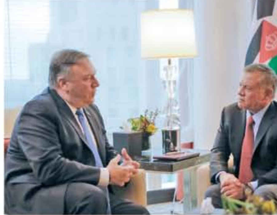
الأميرة في واشنطن كما التقى جلالة الملك عبدالله الثاني، في نيويورك امس الأمير مع سمو الشيخ عبدالله بن زايد آل نهيان وزير الخارجية والتعاون الدولي في دولة الإمارات العربية المتحدة وذلك في إطار التنسيق والتشاور بين البلدين حيال الأردنية في واشنطن.

التقى جلالة الملك عبدالله الثاني، في نيويورك امس الأحد، على هامش اجتماعات الجمعية العامة للأمم المتحدة، وزير الخارجية الأمريكي مايك بومبيو، حيث جرى بحث علاقات الشراكة الاستراتيجية الأردنية الأمريكية، وصد من القضايا الإقليمية والدولية. وتناول اللقاء تطورات عملية السلام، حيث أكد جلالة الملك أهمية إعادة إحياء المفاوضات بين الفلسطينيين والإسرائيليين، استناداً إلى حل الدولتين، وبما يحقق إقامة الدولة الفلسطينية المستقلة وعاصمتها القدس الشريفة، تعيش بأمن وسلام إلى جانب إسرائيل. وتعبرق اللقاء إلى الأزمأة التي تواجهها وكالة الأمم المتحدة لإهانة وتنفيذ اللاتين الفلسطينيين "الأوترو"، حيث أكد جلالته ضرورة أن يتحمل المجتمع الدولي مسؤولياته في توفير الدعم اللازم للوكالة بواسطة تقديم خدماتها، لأكثر من خمسة ملايين لاجئ فلسطيني مسجلين لدى الأمم المتحدة، في المجالات التعليمية والصحية والإغاثية. كما تطرق إلى الأزمأة السورية، وضرورة دعم الجهود المستهدفة للوصول إلى حل سياسي لها، وبما يحافظ على وحدة سوريا وتماسك شعبها. كما جرى استعراض الجهود الإقليمية والدولية في الحرب على الإرهاب، ضمن نهج شمولي. وحضر اللقاء وزير الخارجية وقنصلون مختربين، ومستشار جلالة الملك مدير مكتب جلالته، والسفيرة