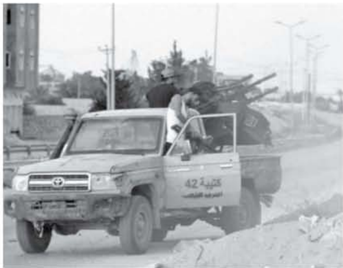
طرابلس - وكالات

صباح اليوم الأحد في بيان على صفحتها بموقع فيس بوك وسادت حالة من الهدوء الحذر صباح اليوم الأحد العاصمة طرابلس بعد المواجهات المسلحة التي شهدتها مساء أمس في منطقتي وادي الربيع وطريق المطار. قبل أن تعود المواجهات من جديد ظهر اليوم. ومثل ٢٦ أغسطس/ اب الماضي تشهد العاصمة اشتباكات مسلحة توقف في ٤ سبتمبر الجاري بعد وساطة الأمم المتحدة. قبل عودتها مجددا خلال الأيام الماضية. وتتسبب في تلك الأحداث عدة أطراف تابعة لحكومة الوفاق. وأخرى مناهضة لها، ومطرف ثالث وهو اللواء السابع القادم من مدينة ترهونة. والمكون من ضباط أغلبهم من نظام معمر القذافي لتحرير طرابلس من ميليشيات المال العام، بحسب ما يزعم في بياناته. وتتقاتل جميع هذه الأطراف على اختلاف أسبابها العلنية ليسقط نفوذها على العاصمة طرابلس التي تعد مركزا لحكم البلاد.