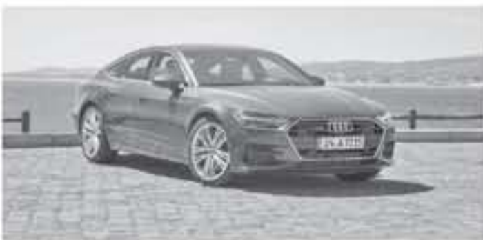
برلين - وكالات

أضواء ليزر HD Matrix، و نظام صوتي D مططور من Bang & Olufsen مكون من ١٩ سماعة، وشاشة قياس ١٢.٣ إنش لنظام الترفيه والمعلومات. وكما ذكرنا سابقاً القلب النابض لسيارة Audi AV Sportback ٢٠١٩ هو محرك TFSI يعمل على البنزين V٦ سعة ٣ لترت مع شاحن توربيني مزود يولد قوة ٣٣٥ حصان (٣٤٠ حصان أوروبي PS) و ٥٠٠ نيوتن متر من عزم الدوران، يتصل بـ فير اس ترونيك من ٧ سرعات ثنائي التحيق (التكثيف)، وتعمل هذه السيارة الأثانية بنظام كاتو للرفع الرباعي للمجلات. تشتمل AV من ١٠٠ إلى ١٠٠ كم/س في ٥.٣ ثانية وتبلغ سرعتها القصوى ٢٥٠ كم/س. حصلت سيارة اودي AV في جيلها الثاني الجديد كلياً على تقنية مايلد هابيدرو، تشتمل على بطارية تدخل عند قيادة السيارة بسرعة ثابتة لتقلل من استهلاك البنزين، وتحتاج هذه السيارة إلى معدل ٦.٣ لتر من البنزين لتقطع مسافة ١٠٠ كم.