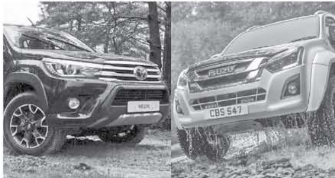
طوكيو - وكالات

السيارة الأمامية، وتوفر السيارة اليابانية درجات عالية من الراحة في القيادة، وتستخدم Miria نظام تويوتا للحلايا الوقود (TFCS) الذي يجمع بين تكنولوجيا خلايا الوقود وتكنولوجيا الهابيدرو. ومؤخراً تحدثنا عن شاحنة مطبوعة من تويوتا تعمل هل الهيدروجين تحمل اسم بروجيكت بورتل ٢٠٠ - Portal.