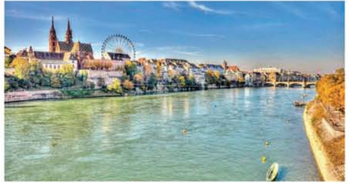
الأنباط - رصد جمانة خنفر

مسأة حسب الوقت من العام المتاحف المتنوعة تضم المدينة مجموعة رائعة من المتاحف والمتاحف الفنية الرائعة، بما في ذلك أكثر من 40 متحفاً للاختيار من بينها، ذلك فضلاً عن كونها موطناً لعرض آرت بازل، وهو أكبر معرض دولي للفن في العالم يقام في شهر يونيو من كل عام بهذه المدينة الساحرة، ويحمل معه قائمة من المعارض، مع مشاركة أكثر من 2500 فنان من جميع أنحاء العالم.