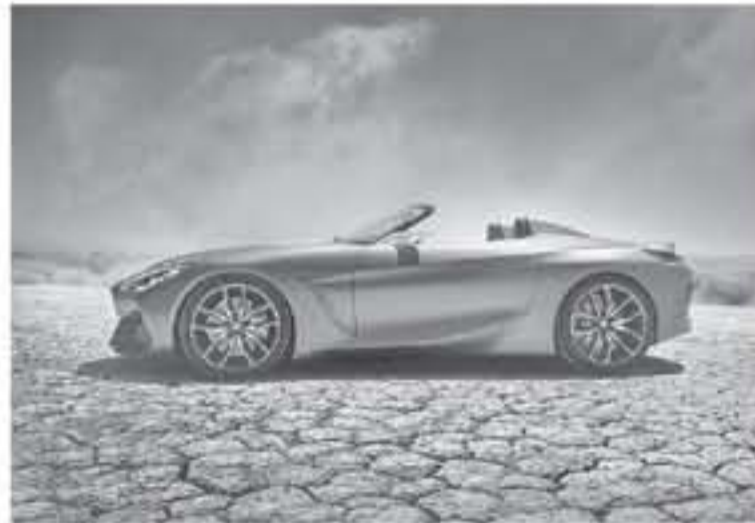
ميونخ - وكالات

الجديدة كلياً على تصميم بوكر انسيابية عالية من خلال خطوط حادة وفتحات تهوية، وتميزت عن نسختها الاختيارية بحولتها على مرآة جانبية معزولة الحجم وليست رفيعاً للغاية بتصميم، من الخلف يستمر التصميم الذي يليق بسيارة