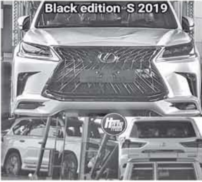
ديبي - وكالات

زواله رياضية، وحصلت هذه النسخة الرياضية من طراز لكزس LX5٧٠ على مصابيح أمامية وخلفية معتمة، وتم تبديل كافة لمبات الكروم الفضية الموجودة في هذا الطراز بأجزاء سوداء اللون تتناسب مع اسم نسخة بلاك ايدشن، كما زودت هذه السيارة بامطارات جديدة سوداء اللون، وبالتأكيد تشمل اللمسات الخاصة إلى داخلية لكزس LX5٧٠. ٢٠١٩ إلى بلاك ايدشن أس التي ستحصل على تجهيزات خاصة وللمسات أخرى تميزها. وما أننا تحدثنا عن سيارة تويوتا لاندكروزر ٢٠١٩ المحدثة ضمن هذا الخبر، من المرجح أن تمثل سيارة تويوتا لاندكروزر ٢٠٢٠ الجيل الجديد من هذا الطراز الذي يناقش بالتحديد سيارة نيسان باترول. وحالتنا يحصل فريقنا على معلومات رسمية تعلق بـ سيارتنا تويوتا لاندكروزر ٢٠١٩ و لكزس LX5٧٠ بلاك ايدشن أس اللتان ظهرتا سراً في موطن الخليج العربي، ستزودكم بالتفاصيل على الفور إن شاء الله.